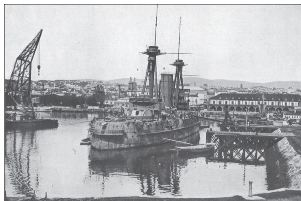
Figura 1. Construcción del acorazado en los astilleros del Ferrol.

La actuación de la Marina española durante la guerra civil de 1936-1939 es bien conocida en sus pautas generales, empezando por las sublevaciones y contra sublevaciones de julio de 1936, continuando con su reorganización en ambos bandos y acabando con los diversos escenarios de los enfrentamientos navales. El análisis de nuevas fuentes, hasta ahora vedadas o de consulta restringida, abre la posibilidad de reconsiderar algunas versiones oficializadas, asentadas en cuanto al relato episódico en la denominada Causa General, elaborada, como es sabido, con un criterio más punitivo y propagandístico que propiamente histórico 1 .