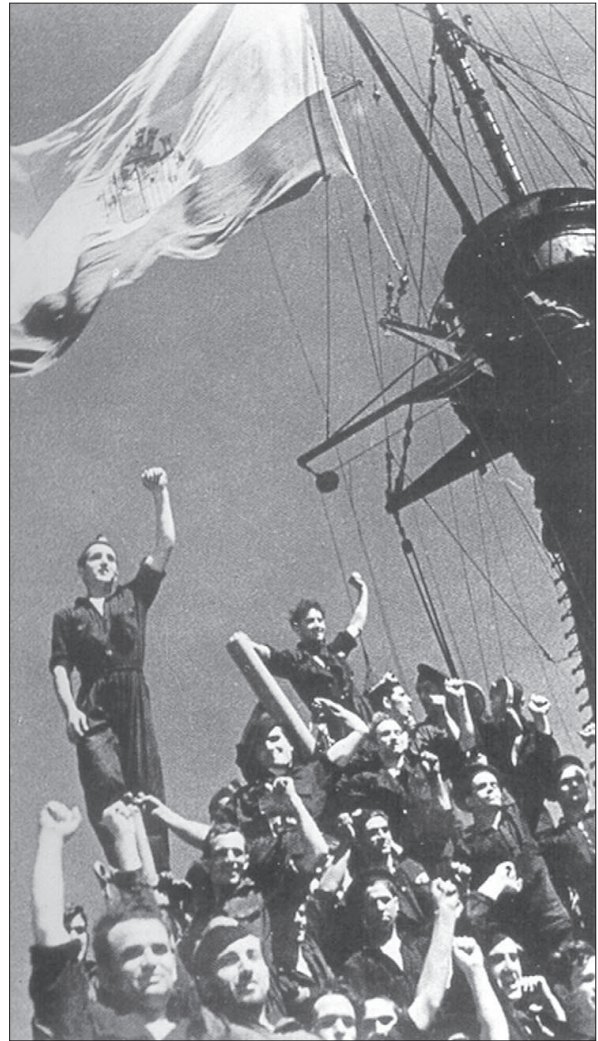
Figura 7. El Jaime I, fiel a la República.