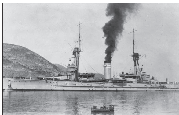
Figura 4. El Jaime I en aguas de Cartagena, en los años de la Segunda República.

"Los oficiales estaban constantemente armados a dos guardias, los pañoles cerrados y las llaves en poder de los oficiales, así como quitadas las llaves de fuego, que los cabos al parecer se habían armado en tierra" 17 .