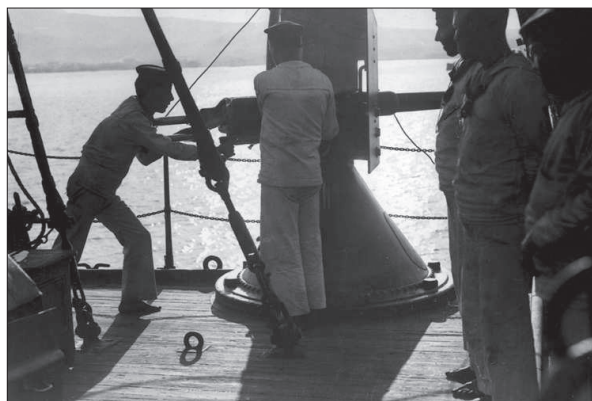
Figura 3. Artilleros del Jaime I .

contabilizan seis auxiliares navales, 11 de artillería, dos de sanidad, tres de oficinas y archivos, 16 de maquinistas, dos de radiotelegrafía, dos de buzos, cinco de electricidad y 18 de máquinas. Su edad media se eleva a los 35 años por la presencia del personal de máquinas, cuyo promedio es de 42,5. Sin ellos se reduce a 30. El 50% ha ingresado en el escalafón durante los años de la II República y más del 80% ha ascendido durante esta etapa. Un elevado número, algo más del 75%, se ha incorporado al acorazado durante 1935. El resto lo ha hecho en 1934 (17%), 1936 (6%) y 1933 (2%). La dotación se completa con 158 cabos y 578 marineros.