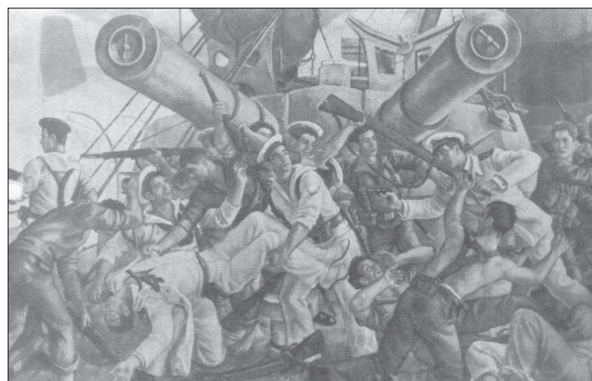
Figura 6. La épica visión de Sáenz de Tejada.