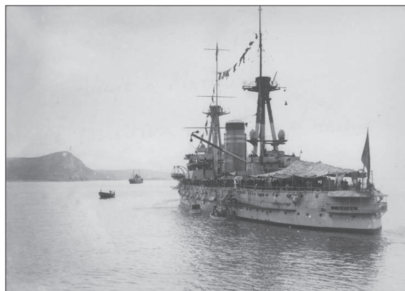
Figura 2. En las proximidades de Ceuta hacia 1927.