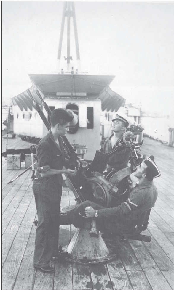
Figura 8. Defensas antiáreas del acorazado.

a lo legislado en materia administrativa y que conceptuaban entorpecedora a sus destructora labor” 89 .