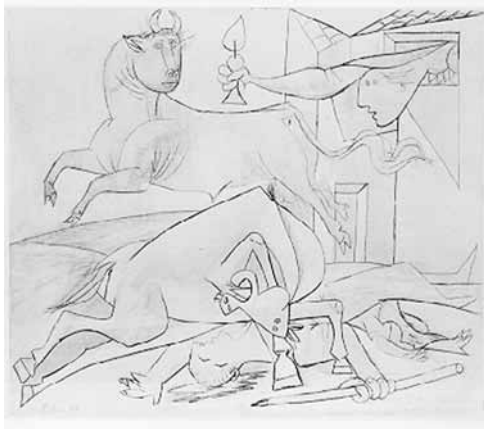
Boceto 10. Estudio de composición del Guernica , fechado el 2 de mayo de 1937.