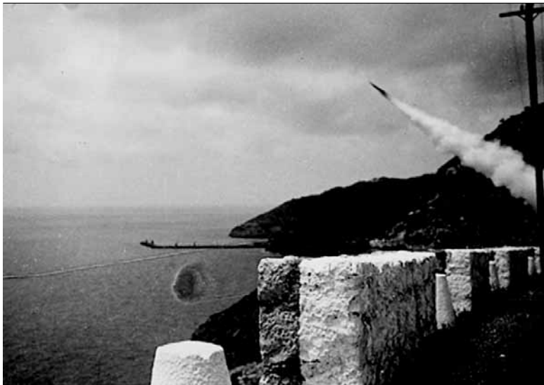
Fotografia 3. Llançament del torpede des del port de Vallcarca.

seves característiques serien d'uns 70 cm de longitud i poc més d'uns 5 o 6 kg de pes.