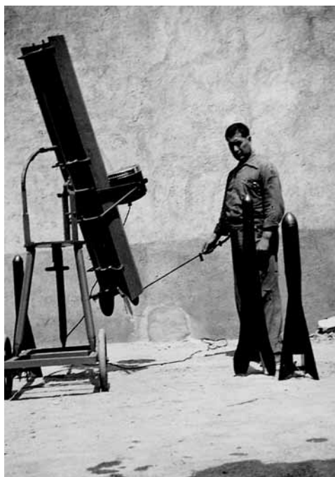
Fotografia 2. El llançador del torpede i els tres tipus de projectils esmentats en l'expedient.

i una llargada de 70 cm. A la part anterior o terminal hi trobem una punta ogival similar a un projectil d'artilleria de 75 mm feta amb planxa de coure. El següent component és la part central del tub-cambra que recobreix l'explosiu. I finalment, la part inferior formada per tres aletes —o estabilitzadors— d'uns 20 cm cada una. En l'interior del coet hi ha el tub-cambra de l'explosiu amb una bomba de 2 kg feta amb fundició i talla de pinya per facilitar l'explosió i augmentar els efectes de la metralla. Aquest sistema semblaria imitar doncs algunes bombes de mà i granades convencionals. A la part baixa de l'interior de l'aparell s'hi trobaria la cambra de gasos del coet amb la seva càrrega propulsora de també uns 2 kg de pes. Val a dir que l'esmentada descripció seria la del coet anomenat pel seu inventor com "de combat" (contra atacs sobre blancs terrestres) i que les