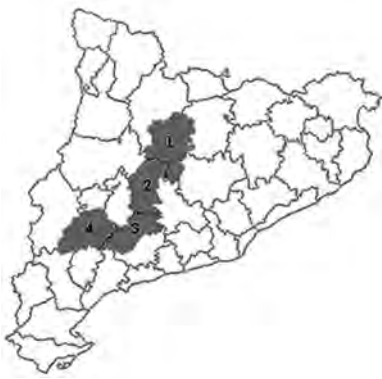
FIGURA 1. Localització de la zona d'estudi, que inclou part de la comarca del Solsonès (1), la Segarra (2), i petites porcions de la Conca de Barberà (3) i les Garrigues (4).

(2008). Per a la nomenclatura hem fet servir la proposada a les obres de Llimona & Hladun (2001) i Hladun & Llimona (2002-2007) amb excepcions justificades.