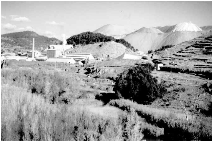
FIGURA 2. Les instal·lacions mineres de Súria. D'esquerra a dreta i de dalt a baix es veu el runam salí, la planta de tractament del mineral, l'àrea de Cerarols amb la vegetació malmesa per la pols salina i el barri del Fusteret on l'aigua salada provinent del runam entra al riu Cardoner.

The mining installation at Súria. From left to right and top to bottom: the saline waste dump; the mineral treatment plant; the Cerarols area, with the vegetation damaged by salty dust; the Fusteret area, where the saline water from the waste dump enters the river Cardoner.