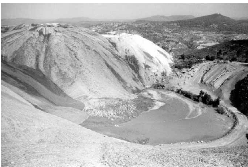
FIGURA 3. El runam salí de Súria, amb el detall de les petites cubetes a la superfície creades per la dissolució de la sal amb la pluja.

The mining installation at Súria. From left to right and top to bottom: the saline waste dump; the mineral treatment plant; the Cerarols area, with the vegetation damaged by salty dust; the Fusteret area, where the saline water from the waste dump enters the river Cardoner.