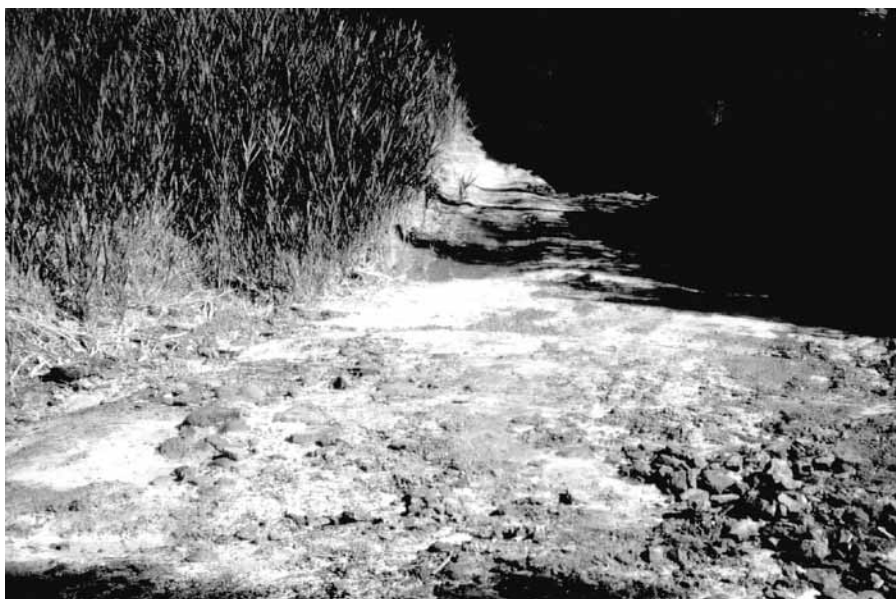
FIGURA 4. La riera de Conangle –Balsareny– és salinitzada pel runam abandonat de Vilafruns. Al marge d'on ve l'aigua del runam s'aprecia el dipòsit blanc de sal, mentre que a l'altre creix un tamarisc, un arbret que tolera sòls lleugerament salins.

The Conangle stream (Balsareny) is salinised by the abandoned Vilafruns waste dump. On the bank where the water from the waste dump enters, a white deposit of salt can be seen, while on the other bank grows a tamarisk, a shrub tolerant of slightly saline soils.