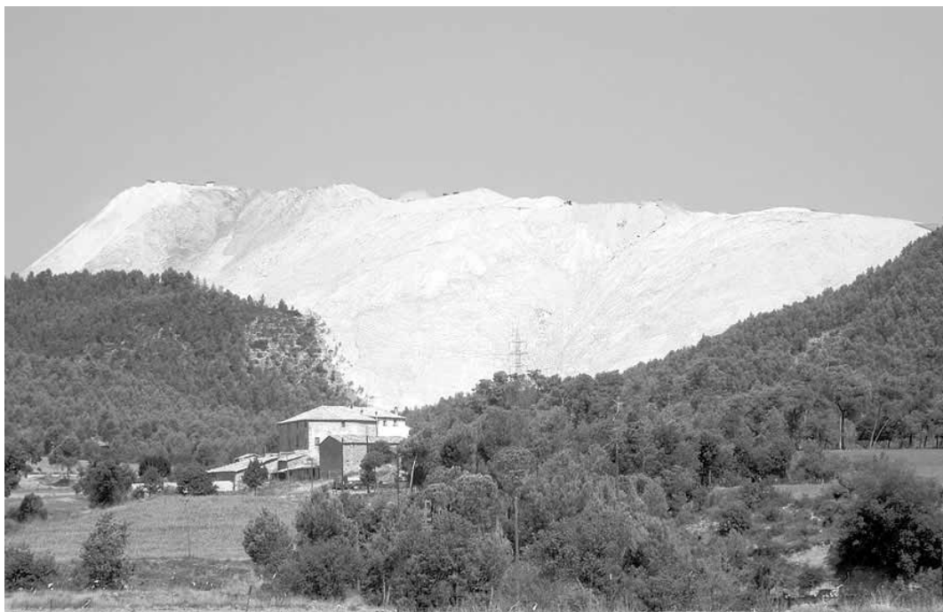
FIGURA 1. El runam salí del Cogulló –Sallent–, amb un ritme d'abocament de 2 milions de tones anuals de residus salins, és ja la muntanya de presència més destacada del pla de Bages.