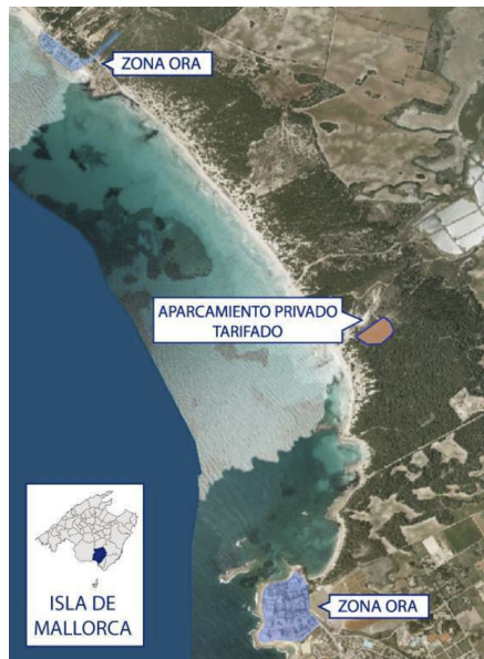
Figura 9. Localización de los aparcamientos tarifados en la playa de Es Trenc.