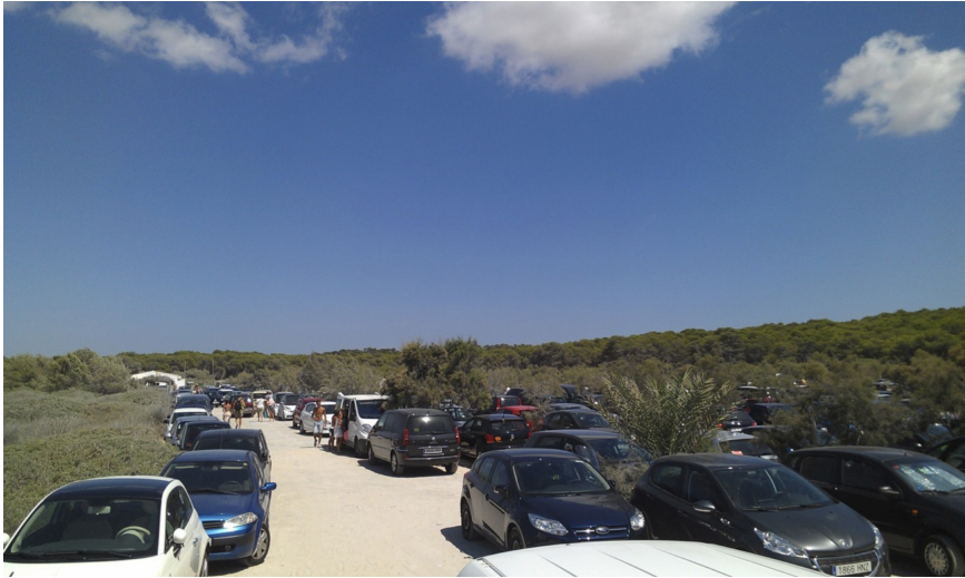
Figura 8. Vista general del aparcamiento privado situado en la parte central de la playa de Es Trenc.