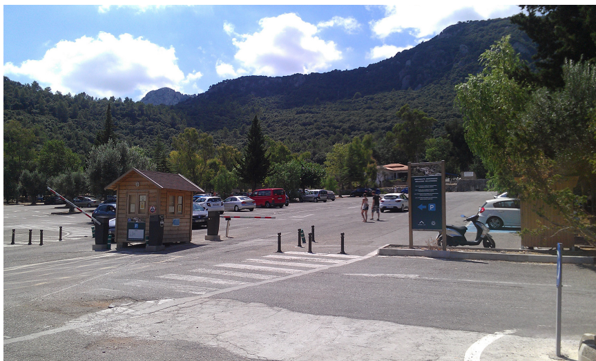
Figura 3. Entrada al aparcamiento tarifado del santuario de Lluc (Escorca).