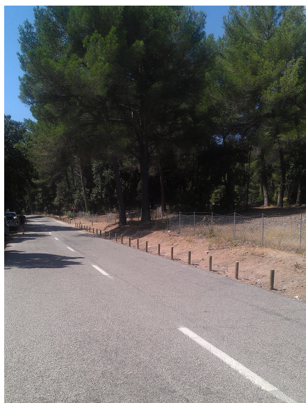
Figura 6. Pilones de madera que impiden estacionar en el arcén de la carretera de Formentor.