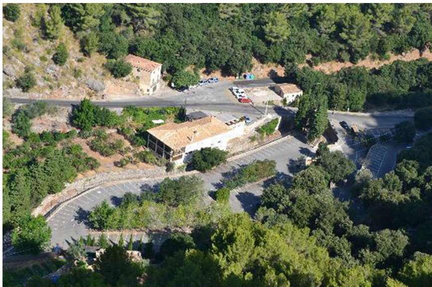
Figura 5. Imagen del aparcamiento tarifado de Sa Calobra (torrente de Pareis).