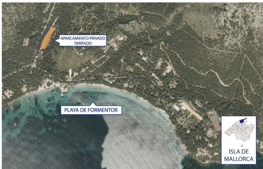
Figura 7. Localización del aparcamiento tarifado de Formentor.