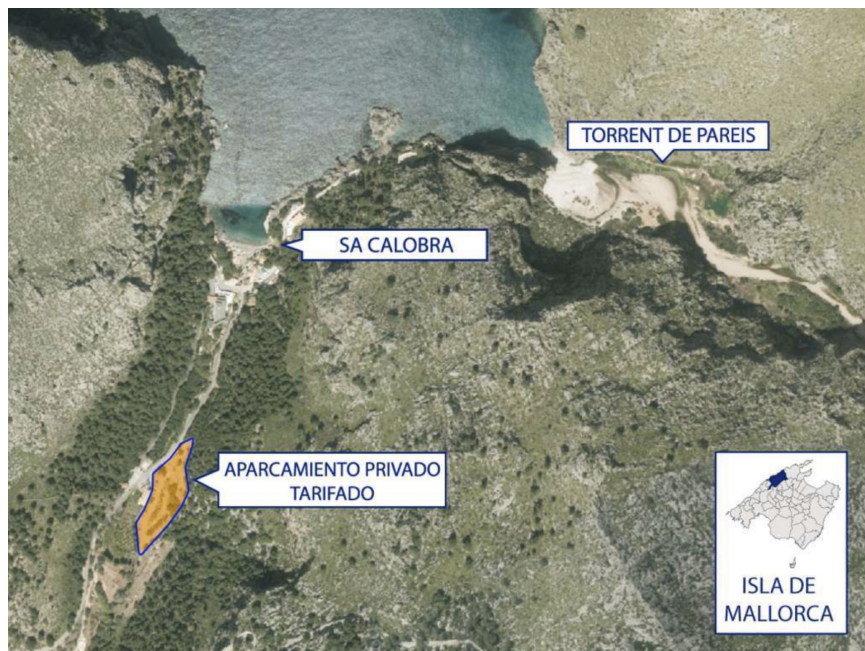
Figura 4. Localización del aparcamiento tarifado de Sa Calobra (torrente de Pareis).