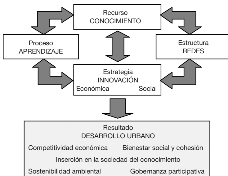
Figura 1. Ciudades innovadoras: componentes, estrategias y resultados.

De este modo, ciudades innovadoras serán aquellas donde se aplica una estrategia consciente y sistemática orientada a producir y transferir un recurso estratégico como es el conocimiento en sus diversas formas (teórico o práctico, científico o simbólico, analítico o sintético, explícito o tácito, etc.), acumulado en su población, sus empresas, sus instituciones públicas y sus organizaciones sociales. El objetivo será ampliar y activar ese stock de capital cognitivo y de capital humano para favorecer el desarrollo local. Para ello será necesario promover procesos de aprendizaje, tanto individual —a través del sistema educativo y de una mejora en el nivel formativo de la población— como colectivo —a través del trabajo conjunto e interactivo que favorece la transmisión de conocimiento tácito, difícil de codificar—, para lograr así un incremento de lo que algunos califican como inteligencia compartida.