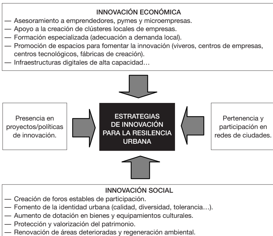
Figura 3. Estrategias de promoción de la innovación en ciudades medias.