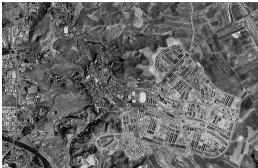
Figura 2. Cuando lo urbanizado es la negación de lo urbano. En Paracuellos del Jarama, miles de viviendas en espacio urbanizado pero no urbano: espacios residenciales de baja densidad, ineficientes, que buscan eliminar la diversidad y la pluralidad social y favorecen el aislamiento y la segregación. ¿Quién y cuándo va a dotar los equipamientos?

y la ausencia de mantenimiento, cuya única «utilidad» para el interés general habrá sido su impacto innecesario.