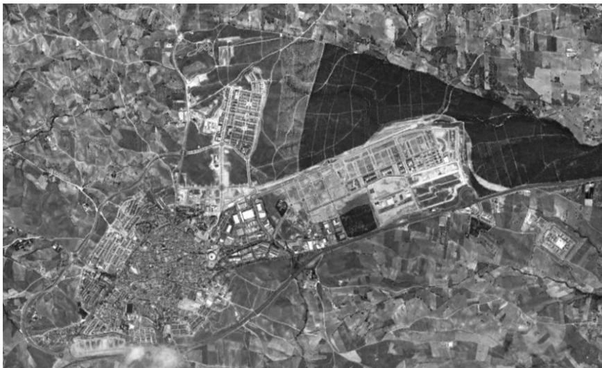
Figura 3. Navalcarnero. Territorio urbanizado y vacío. ¿Se podrá impedir su progresivo deterioro? ¿Se ocupará alguna vez?