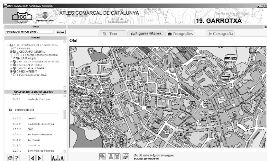
Figura 2. Mostra de planimetria urbana elaborada per als atles.

a escala 1:8.000. Els mapes s'han realitzat a partir de la informació planimètrica del Mapa Topogràfic de Catalunya 1:5.000 (ICC) i s'han complementat amb la informació de l'Ortofotomapa de Catalunya 1:25.000 (ICC), fotografies dels vols dels anys 2004 i 2005 (ICC) i informació recollida als ajuntaments. Els nous mapes actualitzen la informació de base municipal a una escala amb molt de detall, a manera de planimetries urbanes, i, fins i tot, en els casos dels municipis petits, són un treball inèdit que supera les aportacions de les geografies generalistes preexistents, centrades gairebé exclusivament en les capitals comarcals i els nuclis de més dinamisme.