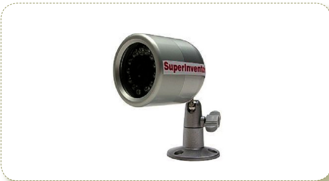
Figura 1. Càmera Intemperie Color 0 Lux