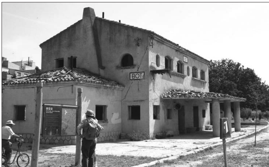
Estat de l'estació de Bot.