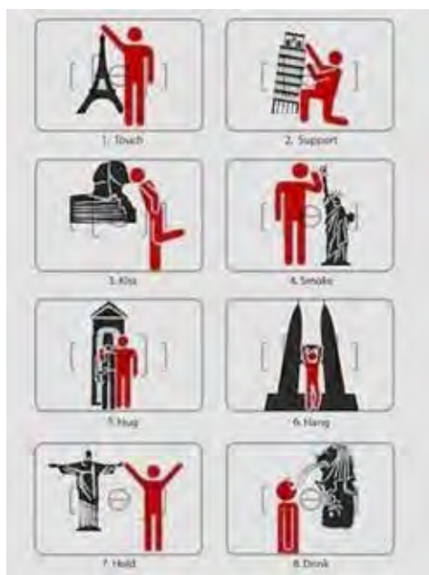
Figura 2. Manual de fotos turísticas. La profecía auto-realizada

http://www.democraticunderground.com/1018397902 [28 de octubre de 2013]