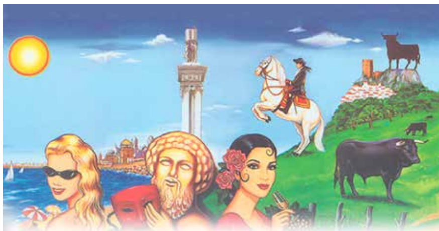
Figura 1. Imágenes estereotipadas constitutivas del imaginario andaluz

La cercanía gana a la distancia y el divorcio entre lo real y lo representado se hace patente. En este sentido el imaginario es nuestra ficción particular, es donde nos recreamos; es algo similar a lo que Žižek teoriza sobre los acontecimientos posmodernos que caracterizan lo contemporáneo: “Una ficción más real que la realidad misma”. 13 Al fin y al cabo “lo imaginario trata de dar consistencia a la realidad”, pues “la pulsión es lo real, y si entra en la representación es en la medida que imaginarizada” (Arroyo y Sádaba, 2012, p. 49-52). Según André Breton, imaginario es aquello que tiende a ser real (Naef, 2012).