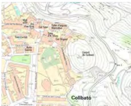
Figura 9. Collbató

Sembla clar que el topònim Collbató va designar primerament l'emplaçament del castell. Mapa: ICGC.