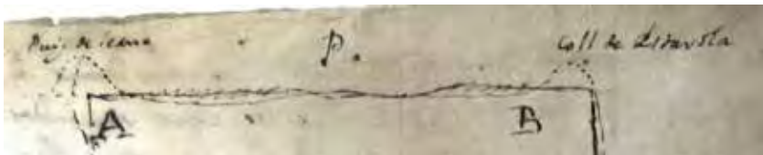
Figura 2. És gaire diferent un Coll d'un puig?

Fragment d'un croquis de 1774 amb les afrontacions d'una quadra o gran propietat, situada a cavall d'Olesa de Bonesvalls i Vallirana, amb el dibuix del perfil de l'anomenat Coll d'Estarola (el document també l'anomena Collbeix i Coll d'Ignarola) i del puig de Seana o Seïada (al document trobem les dues formes, l'actual és puig Saiada).