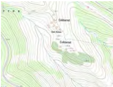
Figura 8. Colldarnat (la Vansa i Fórnols)

Un Coll sovint correspon també al replà d'una serra. Mapa: ICGC.