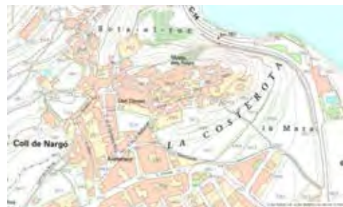
Figura 7. Coll de Nargó

El poble neix enlairat dalt d'un Coll, no a cap lloc de pas (el camí ral sempre ha estat a la vora del Seure). Mapa: ICGC