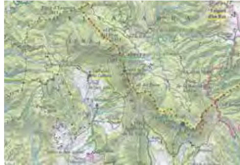
Serra de Cabrera és probablement una adaptació moderna del topònim Collsacabra .

La serra (el Coll) és l'element que presideix el paisatge de l'altiplà del Cabrerès. Mapa: ICGC