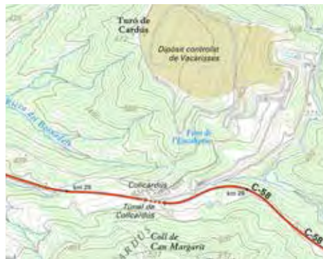
Figura 10. Colcardús

Colcardús ha esdevingut turó de Cardús. El nom antic perviu a la masia, que certament és en un coll 'modern'. Mapa: ICGC