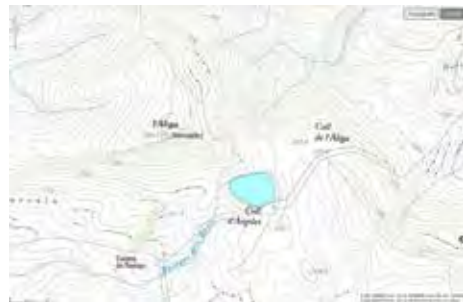
Figura 3. Coll de l'Àliga (el Pinell de Brai)

Coll de l'Àliga (límit entre el Pinell de Brai i Miravet), exemple de “depuració” cartogràfica dels topònims considerats dissonants. Del pic s'ha eliminat el genèric coll , i el topònim sencer s'ha traslladat al punt topogràficament més semblant al que és un coll en el català estàndard. Mapa: ICGC.