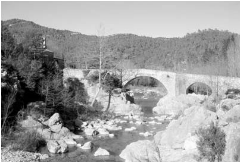
Autor: David Pavón