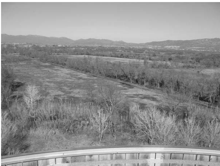
Autora: Anna Ribas