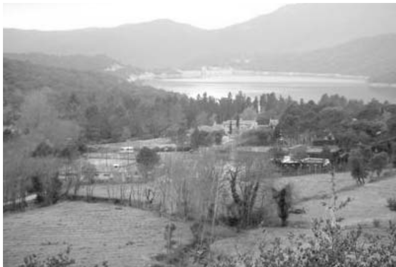
Autor: David Pavón