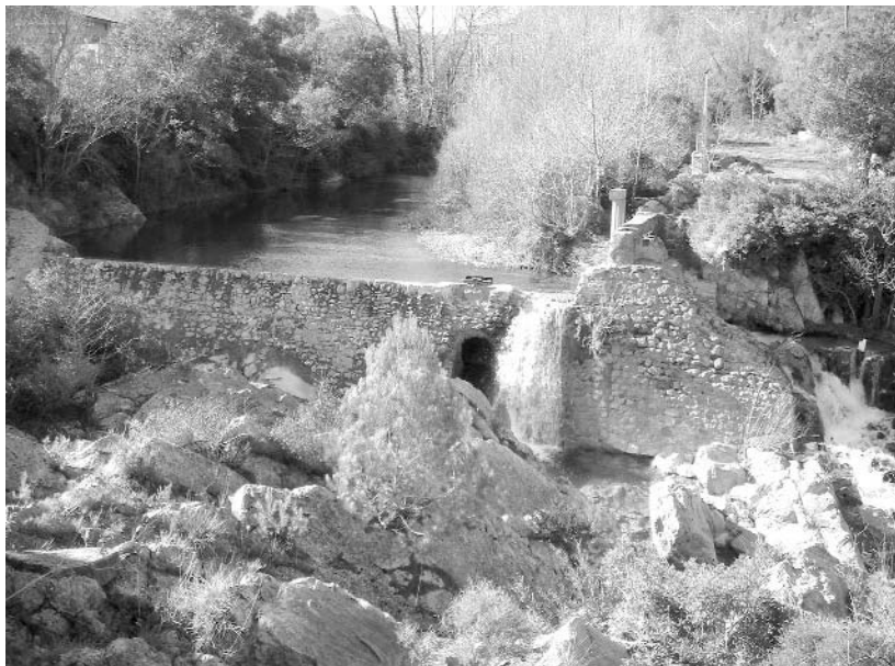
Autor: David Pavón

L'objectiu d'aquest article és fer una aproximació al procés històric de creació dels anomenats “paisatges de l'aigua” a la plana de l'Alt Empordà. En primer lloc, es presenten els principals elements que configuren els paisatges de l'aigua a la plana, com serien els rius, les rieres, els aiguamolls, els estanys, les closes, les motes, els embassaments, les sèquies i els canals de regadiu. A continuació, s'analitza el procés històric de creació dels paisatges de l'aigua a la plana de l'Alt Empordà a través d'un discurs que s'ha simplificat en dues grans etapes: una llarga etapa caracteritzada per la lluita mantinguda per la societat altempordanesa contra l'aigua i, una segona etapa, molt més recent, on els esforços d'aquesta societat es concentren en l'obtenció d'aquesta aigua. Per a la primera etapa s'utilitza com a exemple d'aquest procés el cas del dessecament dels estanys, llacunes i aiguamolls de la plana empordanesa, en concret el cas de l'estany de Castelló, mentre que per a la segona etapa cas s'analitzen els canvis socials i territorials que s'han donat a la conca de la Muga, el riu altempordanès per antonomàsia, en relació als usos de l'aigua en els darrers 50 anys i que expliquen en bona part els canvis experimentats en els paisatges de l'aigua d'aquesta conca. L'article acaba amb un darrer exercici que consisteix a agafar el paisatge configurat per les