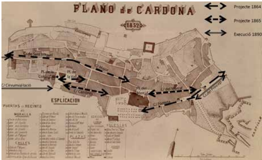
Figura 7. Les alineacions dels carrers de Cardona, 1864, 1865 i 1890