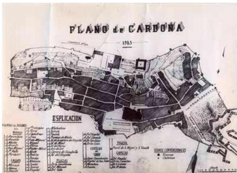
Figura 8. El plànol geomètric de 1905