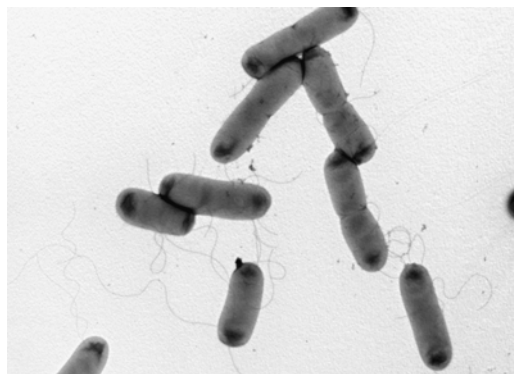
FIGURA 1. Imatge de cèl·lules d' E. coli obtinguda per microscòpia electrònica de transmissió. Es poden observar unes estructures filiformes que corresponen als flagels.

E. coli pot sintetitzar tots els components cel·lulars necessaris a partir de diferents fonts de carboni, és un bacteri fàcilment cultivable que pot créixer en una àmplia varietat de medis de cultiu, incloent-hi medis de composició química definida. La