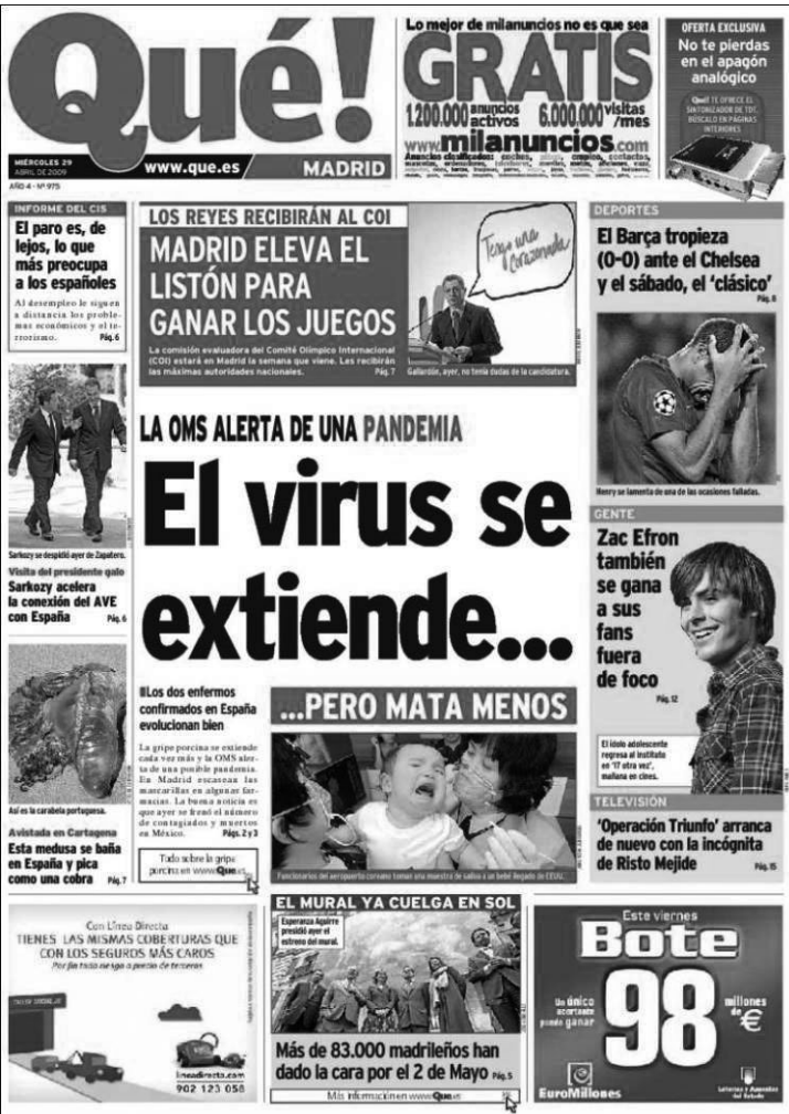
Figura 4. Portada de Qué!