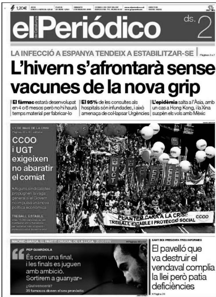
Figura 3. Portada d' El Periódico : «L'hivern s'afrontarà sense vacunes de la nova grip», amb l'avantítol «La infecció a Espanya tendeix a estabilitzar-se».