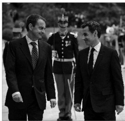
Los presidentes de España y Francia, Zapatero y Sarkozy, se miran sonrientes, ayer en La Moncloa.

Además, en España, el Ministerio de Sanidad confirmó un segundo caso positivo y 32 en estudio, pero insistió en el mensaje de calma: «ninguno grave». Sigue en página 14