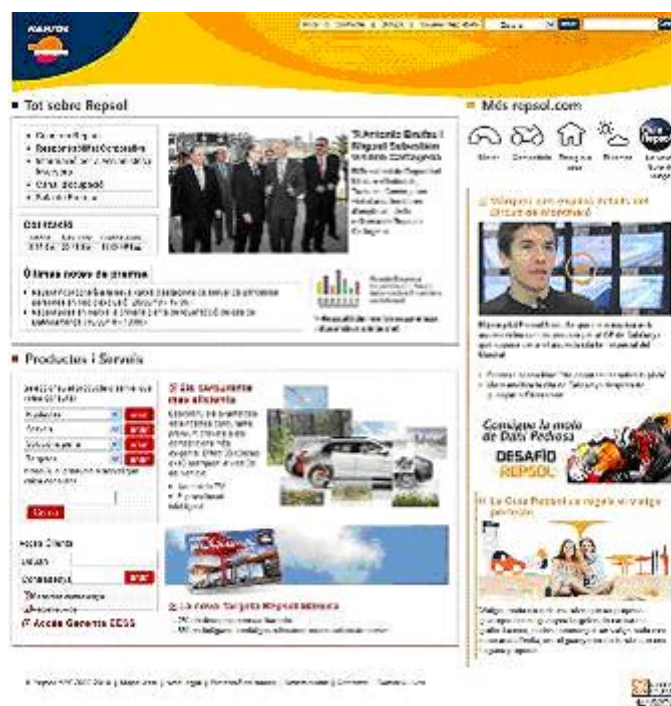
Fig. 1: Página inicial de repsol.com en catalán (30-06-2010)

Repsol fue la primera de entre las empresas del IBEX 35 en ofrecer y mantener prácticamente todos los contenidos de su web pública en las lenguas cooficiales, además de otros idiomas. Una de las más grandes webs en volumen de contenidos y servicios, con actualizaciones diarias, más de tres millones de usuarios y múltiples premios nacionales e internacionales, repsol.com es uno de líderes en comunicación digital en España según los más prestigiosos estudios que valoran webs de compañías y referentes en Europa, al estar siempre entre las 10 primeras posiciones.