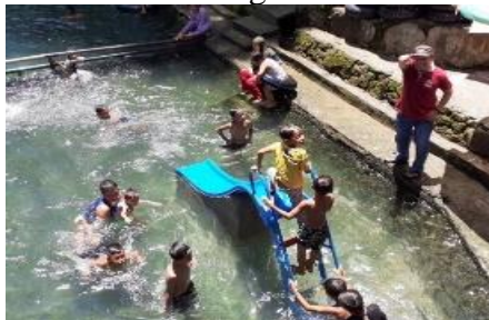
Gambar 3.3 Pembuatan Prosotan