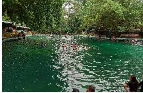
Gambar 2.1 Pemandian Sweembath

huluan, Kabupaten Simalungun, yaitu pengembangan potensi pariwisata kolam pemandian alami yang terkenal dengan nama "Sweembath" atau "Mata Air Alami (Umbul)" merupakan daerah kekuasaan Partuanan Naga Bayu, dimana masyarakat Partuanan Naga Bayu memanfaatkan umbul (mata air) yang ada dikawasan untuk mengambil air bersih. Tahun 1930 oleh pemerintah Belanda dengan memekerjakan buruh-buruh perkebunan. Pemandian Umbul dibangun dijadikan sebagai tempat hiburan oleh orang-orang Belanda, maka diberi nama "Sweembath" gambar 1