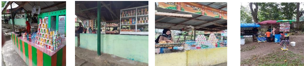
Gambar 3.10 Barang Dagangan

Pedagang yang menjual jenis-jenis produk barang dagangan, souvenir dapat dilihat pada gambar 12 di bawah ini