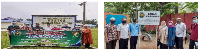
Gambar 2.2 Tim Desa Binaan Simalungun LPPM USU

Setelah Indonesia merdeka pengelolaan diserahkan ke perkebunan negara, karena setelah tahun 1945 HGU (Hak Guna Usaha) menjadi milik PTPN IV Laras (Purba, 2012). Sekarang ini, kawasan wisata "Sweembath" telah diserahkan kepada masyarakat setempat sebagai pengelola wisata desa. Dengan meninjau segi sumber daya lokal alami yang dimiliki kawasan tersebut agar berkembang menjadi desa wisata maka dengan program yang dilakukan Tim Desa Binaan Simalungun LPPM USU dapat dilihat pada gambar 2, dilakukan antara lain program pembangunan dan perbaikan sarana dan prasana di lingkungan wisata Sweembath di Desa Naga Sopa Kecamatan Bandar Huluan, Kabupaten Simalungun untuk mewujudkan Kesejahteraan Masyarakat