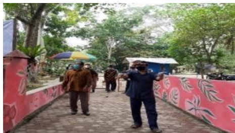
Gambar 3.5 Perbaikan Tembok di Pintu Masuk