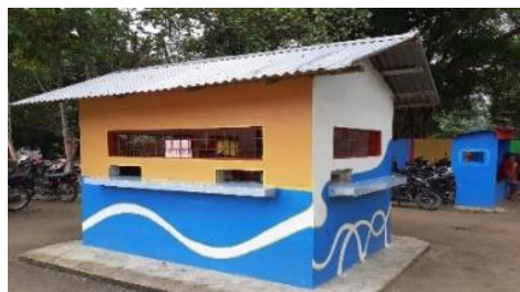
Gambar 3.7 Perbaikan pembelian karcis serta tempat pemotongan karcis