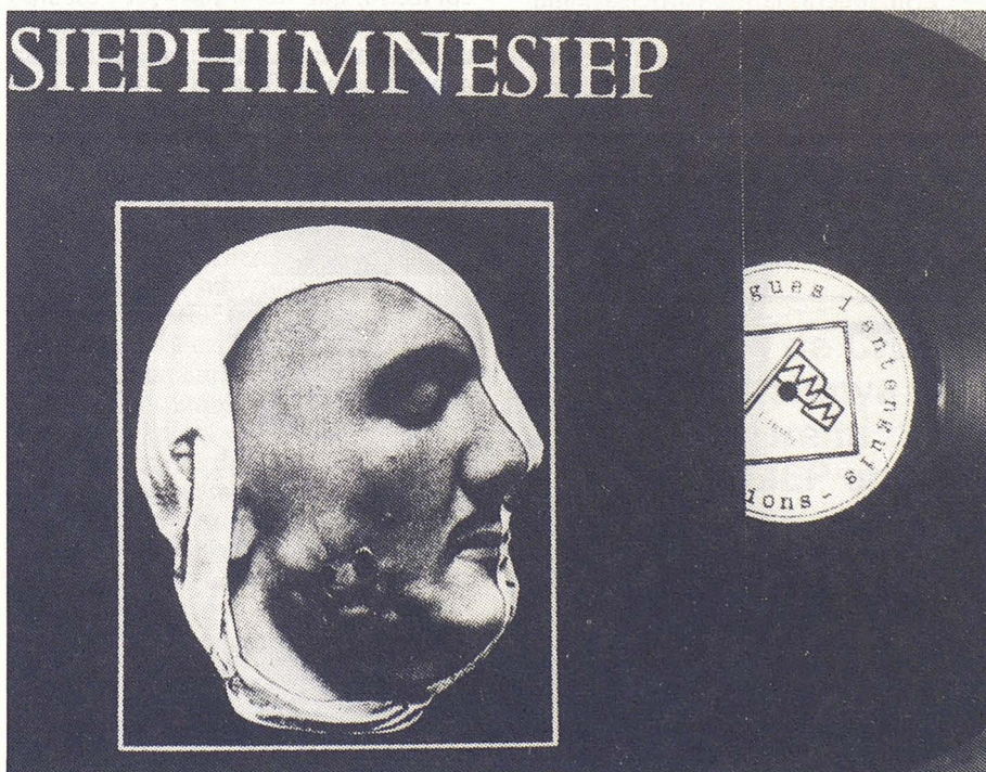
Tramesa de l'himne de la SIEP

Contràriament al que pot semblar, la decisió de recórrer a l'art postal no prové d'un procés d'intel·lectualització ni a un desig d'obrir-se al mail art sorgit de les tendències conceptuals dels anys setanta, tot i ser conscients de la seva existència. La proposta de la SIEP funcionava en un sentit oposat: en lloc de ser múltiples artistes que enviaven trameses a un sol destinatari que organitzava l'exposició sobre un tema, es tractava d'un sol artista que feia arribar el seu art a múltiples perso-