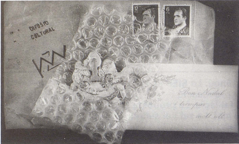
Felicitaçió de Nadal de la SIEP.

nes. De l'art postal n'agafava la presentació, els factors sorpresa i atzar, i de col·lita pròpia s'hi afegia la provocació amb unes intencions concretes de cridar l'atenció a un públic concret, i una estètica acurada, fins i tot elegant, condició que no massa sovint ha estat tinguda en compte en els terrenys de l'art postal.