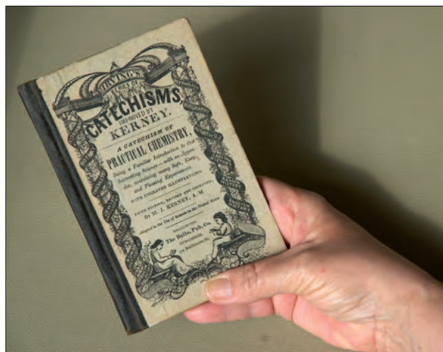
FIGURA 2. Catechism of practical chemistry , de Kerney (1854), que mostra les dimensions reduïdes característiques dels catecismes bàsics.

Molt. En unes dècades es van publicar nombroses obres d'aquest estil, escrites per Joyce [7], Pinnock [8], Roberts [9], Graham [10], Irving [11], Johnston [12], Kerney [13] (de fet, es tracta d'una edició revisada del catecisme d'Irving, figura 2), Haines [14] i Neat [15].