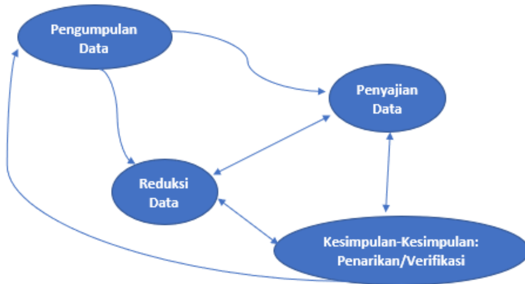
Gambar 2. Langkah penelitian

Analisis data kualitatif dilakukan secara terus menerus hingga mencapai titik jenuh dimana sudah tidak terdapat data baru lagi[14]. Demikian pula dengan penelitian ini dimana peneliti akan menganalisis secara berulang-ulang hingga tidak diperoleh lagi data baru. Tahapan analisis data pada penelitian ini dapat dilihat seperti pada Gambar 2 .