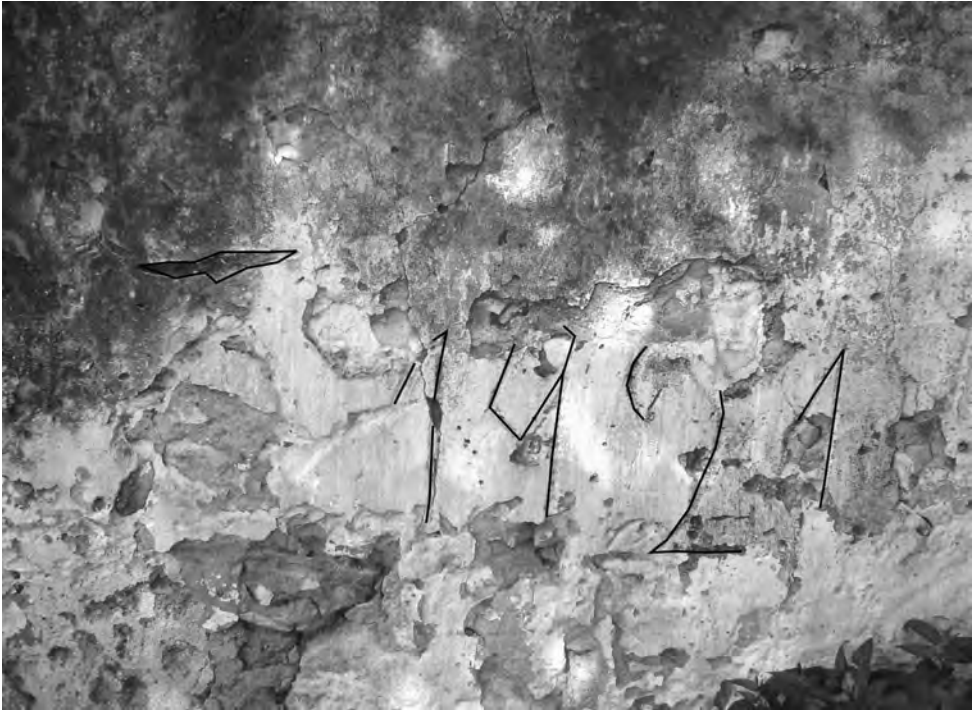
□ Grafiti que recorda fins on va arribar l'aigua a l'any 1921 a Mas de Sendrós.

Els conreus de la vora del riu van anar canviant amb l'entrada al segle xx. Entre els anys 1905 i 1910 s'introduí massivament el cultiu de l'avellaner a l'horta rierenca, fet que ja va suposar un cop dur al conreu del cànem, del lli i del cereal. La nit de la gaianada del 21 es pot considerar com l'acta de defunció del cànem a la Riera, que havia tingut una importància cabdal en l'expansió de la indústria a domicili, és a dir, els teixidors, i de retruc pel creixement del poble al segle XVIII. No hem d'oblidar que la Riera, durant el set-cents i el vuit-cents, va ser el poble on hi havia més teixidors i aprenents de tot el Baix Gaià.