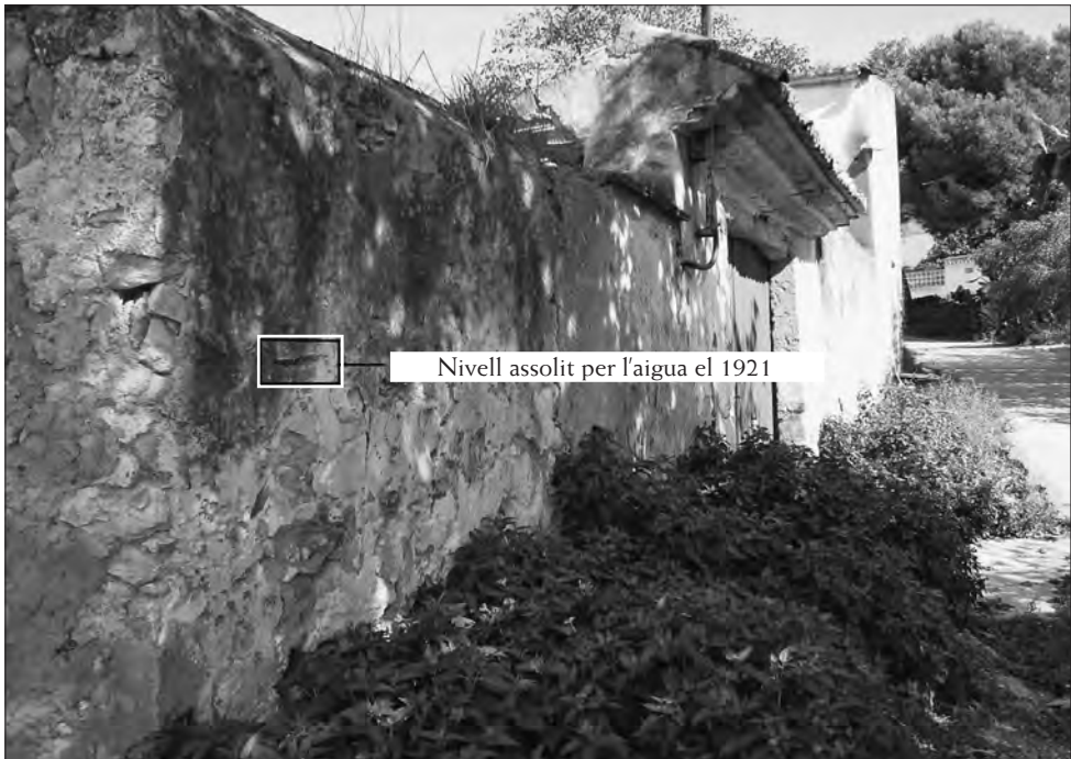
□ Nivell assolit per l'aigua a Mas de Sendrós.

Un altre indret del poble que va quedar negat per les aigües fou el Mas Sendrós , situat a nivell de les hortes d'on els seus habitants van haver de ser salvats per veïns del poble que els van treure per les finestres portant-los a coll. L'aigua del riu en aquest mas va arribar gairebé als dos metres i tot just al costat de la porta d'entrada hi ha una marca de fons on va arribar. També el Mas de l'Espina , que es trobava al costat mateix del torrent a l'altra banda del poble, va quedar ple de l'aigua que baixava des de Salomó i va ofegar tot el bestiar.