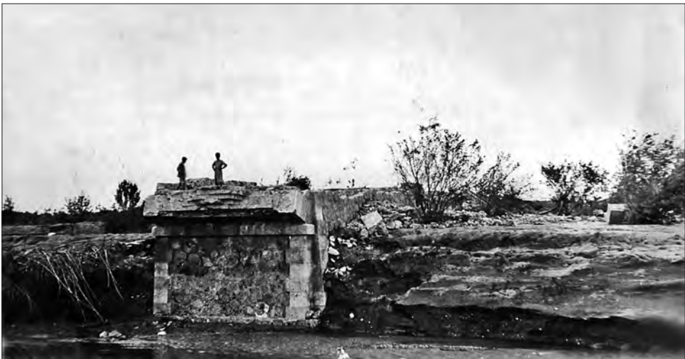
☐ Restes del pont que va prendre la gaianada (1921).