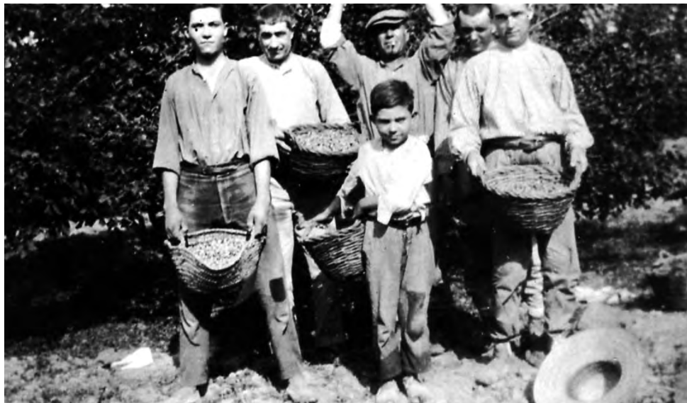
□ Pagesos fent la collita de les avellaneres a finals dels anys vint.

Avui dia, si ens hi fixem, moltes terres amb avellaners i altres arbres de fruit estan quasi dins de la mateixa llera del riu. Això ens fa pensar que molts no recorden els desastres de l'any 1921. El fet de guanyar terres al riu ha estat sempre una constant, tot i així, l'actual embassament del Catllar evitaria una vinguda d'aigües com aquella. Per aquest motiu de confiança, a partir de l'any 1975 els pagesos decidiren de cultivar terres que pertanyien al riu.