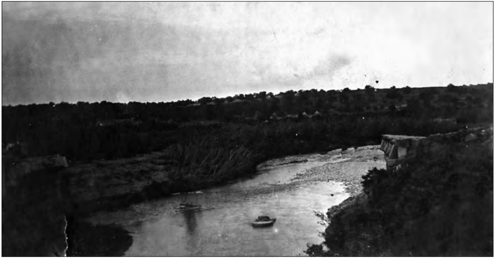
□ Imatge del riu Gaià a l'alçada del pont dies després de la Gaianada.

Els antics rierencs, i els nostres avis encara avui dia, diferencien també el que és una torrentada d'una gaianada. Una torrentada és una vinguda d'aigües sobtada a través del torrent sec després d'un període de pluges intenses als pobles i serralades interiors com la Nou i Salomó fins arribar a les muntanyes de Montferri.