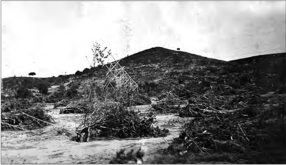
□ Imatge dels avellaners arrancats per la gaianada a l'alçada de la partida de Mas de Benet (1921).

barranco, se halla vaciada, rellena de barro y piedras sin vestigios de camino transitable. A derecha e izquierda, [plana de Ferran] llanuras inundadas, lodazales, campos cubiertos de avellanos conservando su codiciado fruto, que la corriente arrancó de cuajo y dejó tumbados, semejando tumbas de un cementerio fantástico.