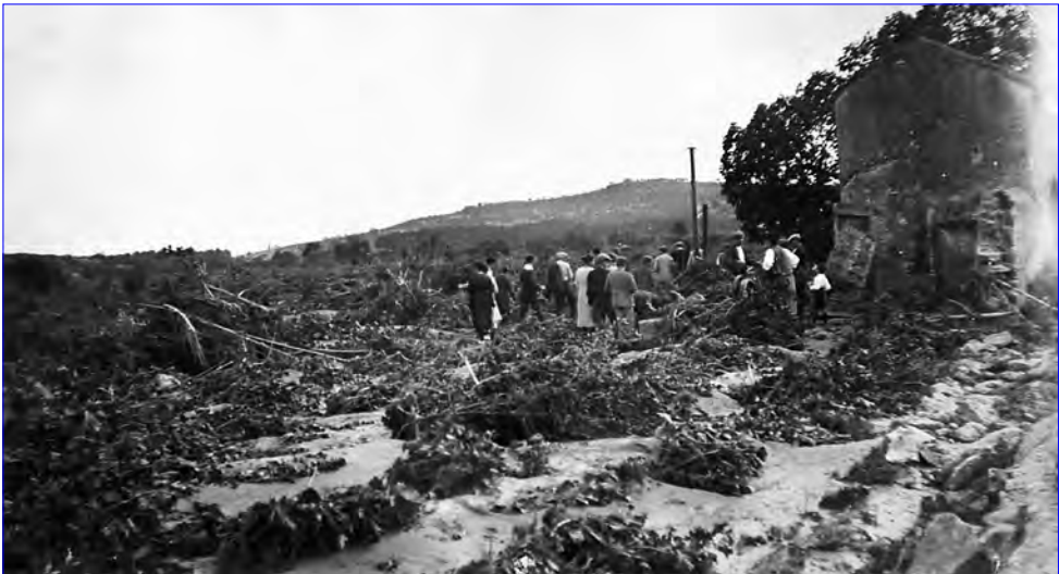
□ Imatge de les destrosses de la gaianada a l'alçada de la Torreta.

A les hortes i camps de la vora del riu no hi quedava res viu, només hi havia multitud d'arbres tombats i tones de fang i pedres que havien estat desplaçades per la riuada. D'arbres arrancats n'hi havia molts, sobretot els avellaners que s'havien plantat al poble feia pocs anys en grans quantitats en substitució de l'històric cànem. Els propietaris van haver de fitar una altra vegada les seves terres perquè les referències s'havien extraviat.