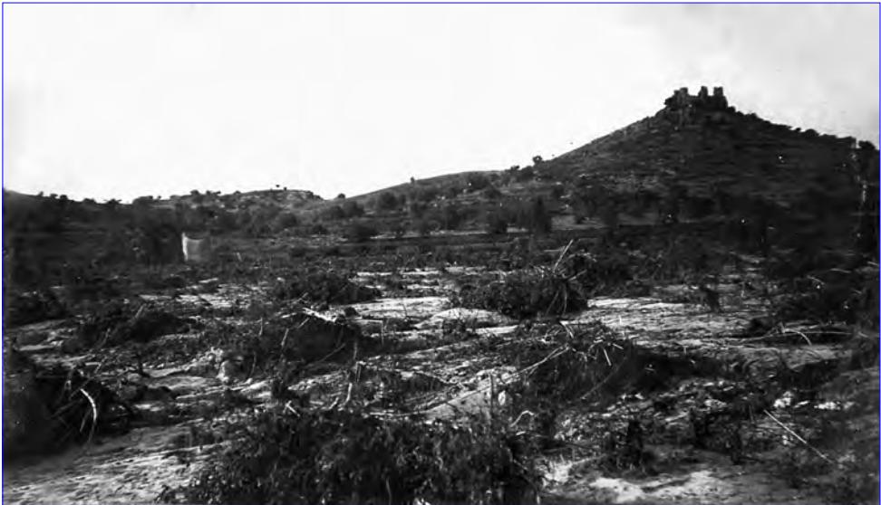
□ Imatge dels avellaners, fang i pedres dipositats sota la muntanya del Castellot (1921).

Los prejuicios son incalculables, pues lo ocurrido no representa sencillamente la pérdida de una cosecha, si no las de seis o siete años y sumas inmensas para quitar el lecho de barro y piedras y reaplanar las huertas, las viñas y los avellanos; mejor dicho, aquellos que fueron fértiles campos, no volveremos a verlos nunca más tal como eran. Hondamente apenados regresamos a la ciudad y con la impresión viva y fresca de lo que vimos, redactamos estas ligeras notas, para llenar nuestro deber, en esta ocasión penoso, de informar al público [...]. 3