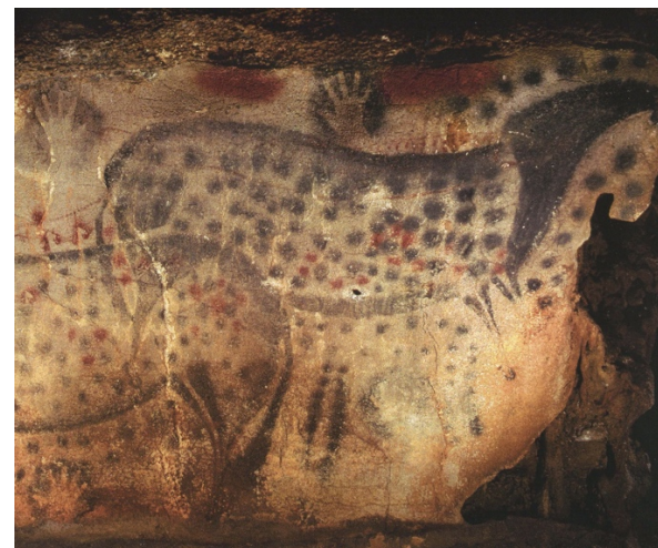
(1) anoniem, het gestippelde paard, 26.000 - 20.000 v.Chr.

Het gaat ook maar om een schets. Een enkele concessie wil ik wel doen: de onderhavige geschiedenis zou moeten worden verteld aan de hand van iconische, of beter gezegd canonieke stippen. Want zonder een canon worden we bedolven onder een lawine van de kinderen van de tijd. Een geluk is wel dat de stip in de kern zelf nooit is veranderd, ondanks haar enorme staat van dienst; zij is de tomeloos vruchtbare moeder van alle kunsten. Vandaar dat ik het voor deze gelegenheid wel aandurf haar lange geschiedenis samen te vatten in een begin en voorlopig eindpunt, met slechts een enkel stipje daar tussenin.