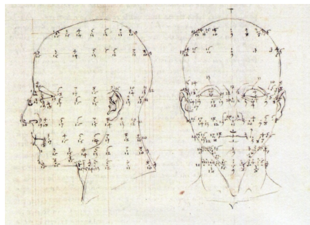
(2) Piero della Francesca, pagina uit De prospectiva pingendi , 1474

delen kan verdelen. Een teken noem ik hier, al wat zich zodanig op het vlak bevindt, dat het oog het kan zien. Dat de schilder niets te maken heeft met de dingen, die we niet kunnen zien, zal niemand ontkennen.' Met punten kan de schilder lijnen maken, ze vervolgens tot allerlei vlakken samensmeden en daar steeds complexere