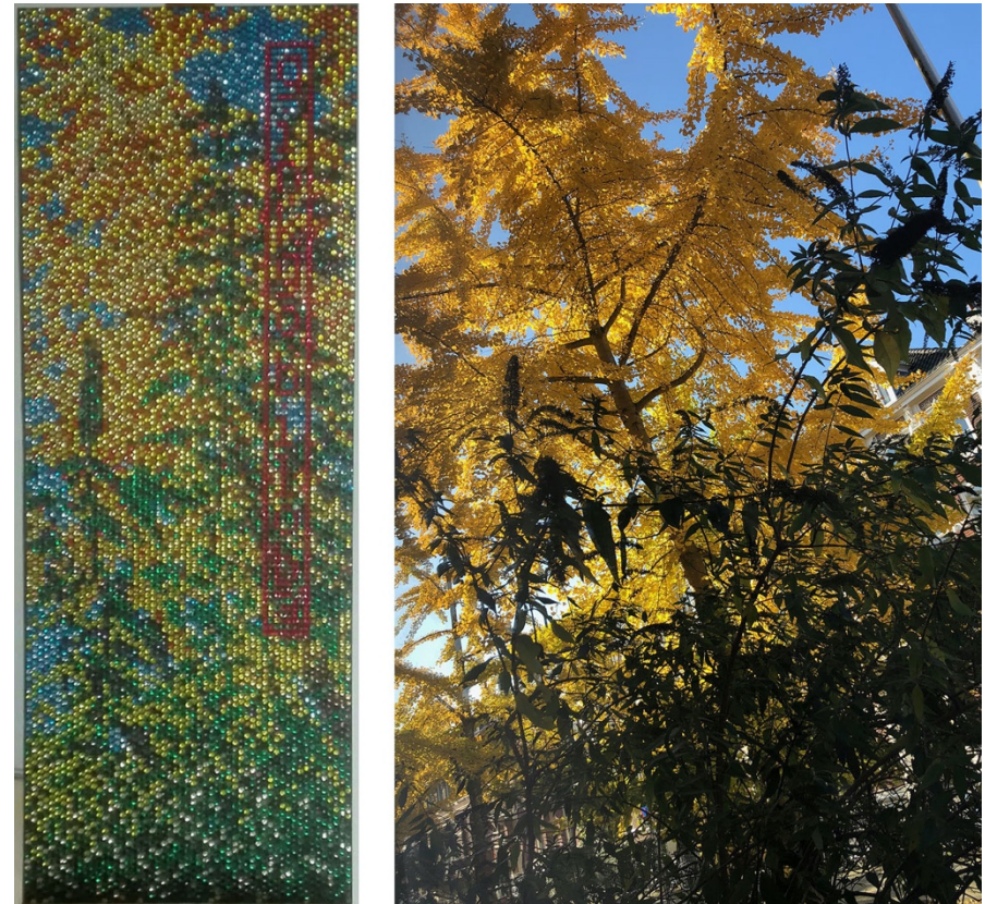
(4) Carel Blotkamp, Ginkgo Biloba , pailletten op foamboard, 2019, 133,5 x 55 cm [links]; Paul van den Akker, foto van een Ginkgo Biloba in Utrecht, november 2019 [rechts]

geruime tijd vormen die kleine, kleurige, glanzende cirkeltjes de oerelementen op jouw atelier (5). Waar gewoonlijk bouwstenen opgaan in het geheel, laat jij ze hun zelfstandigheid behouden. Vrij naar Kandinsky: de pailletten spreken en zwijgen. In een van de recentere werken laten zich rode pailletten in een verticale strook slechts letter voor letter lezen (4).