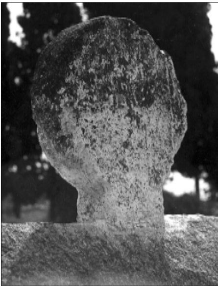
□ El Pont d'Armentera, estela PDA 01, cara a

□ Denominació de les diferents parts d'una estela discoïdal