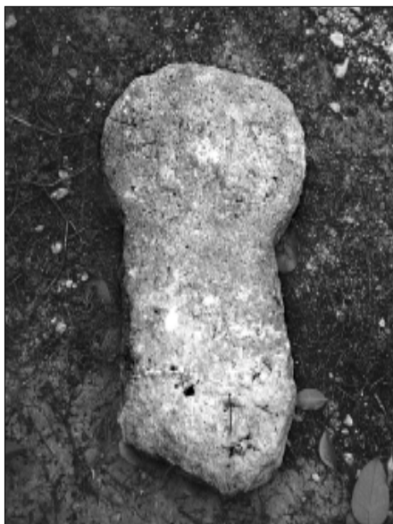
□ El Pont d'Armentera, estela PDA 06, cara b