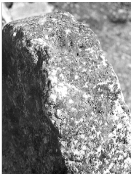
□ Querol, estela QUER 05, perfil

FERRER, A.: "El poblamiento ibérico del Panadés y extensiones". Ampurias IX-X (1947-48), pàg. 272-286.