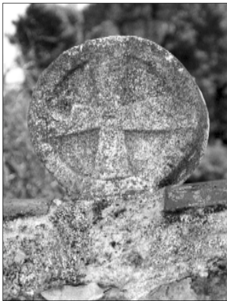
☐ Querol, estela QUER 03, cara a (autor: Pau Arroyo)