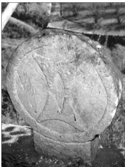
□ El Pont d'Armentera, estela PDA 05, cara b