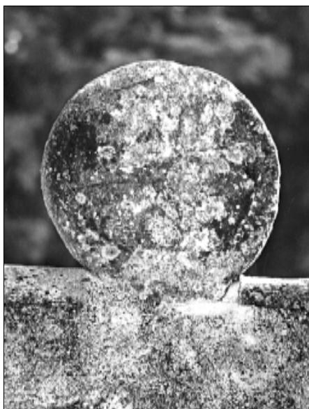
☐ Querol, estela QUER 05, cara a (autor: Pau Arroyo)