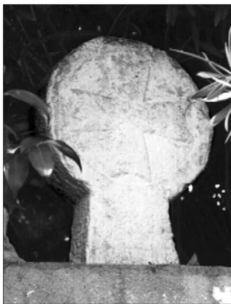
□ El Pont d'Armentera, estela PDA 03, cara a