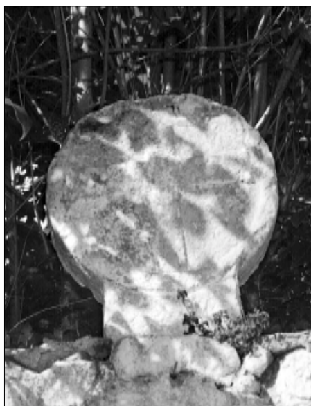
□ El Pont d'Armentera, estela PDA 05, cara a