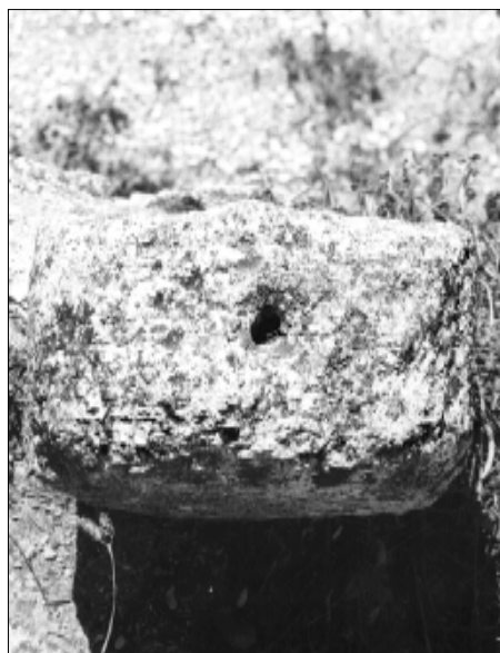
☐ Querol, estela QUER 04, perfil