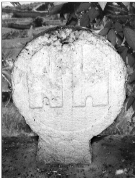
□ El Pont d'Armentera, estela PDA 04, cara b