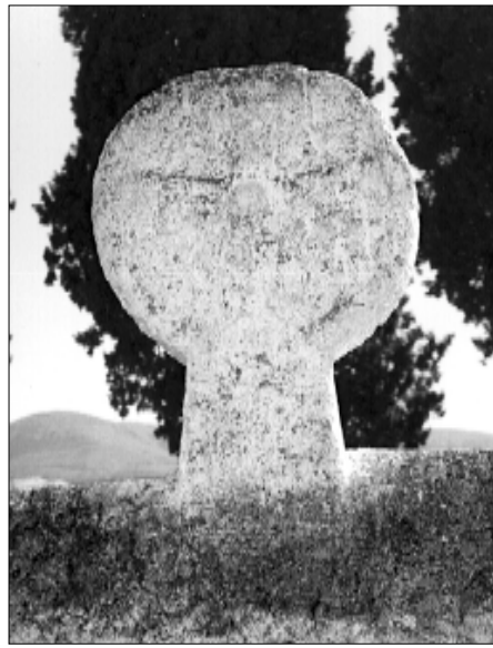
□ El Pont d'Armentera, estela PDA 02, cara a