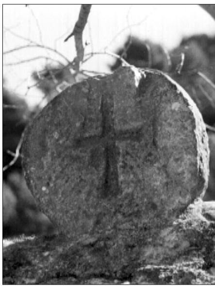
☐ Querol, estela QUER 02, cara a