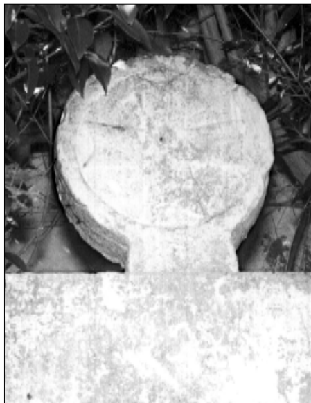
□ El Pont d'Armentera, estela PDA 04, cara a