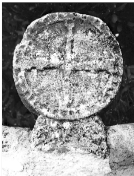
☐ Querol, estela QUER 01, cara a