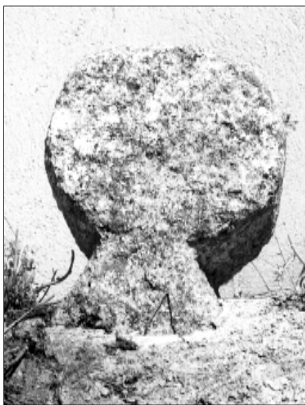
☐ Querol, estela QUER 04, cara a