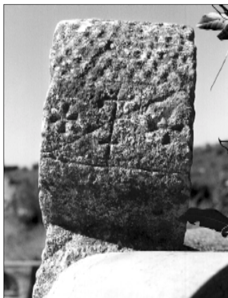
☐ Querol, estela QUER 03, perfil