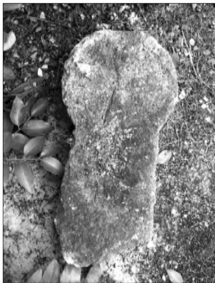
□ El Pont d'Armentera, estela PDA 06, cara a