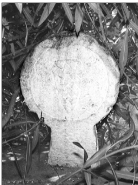
□ El Pont d'Armentera, estela PDA 03, cara b