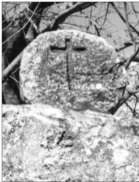
☐ Querol, estela QUER 02, cara b