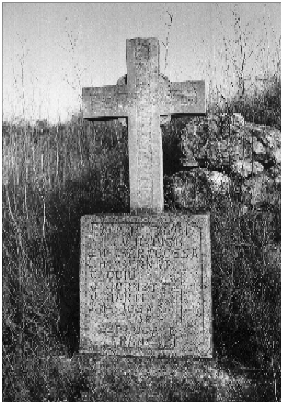
□ Sis veïns de l'Espluga de Francolí varen ser assassinats el 17 d'agost del 1936 a la carretera de Valls al Vendrell, damunt de Vilardida. Una creu de pedra en fa memòria