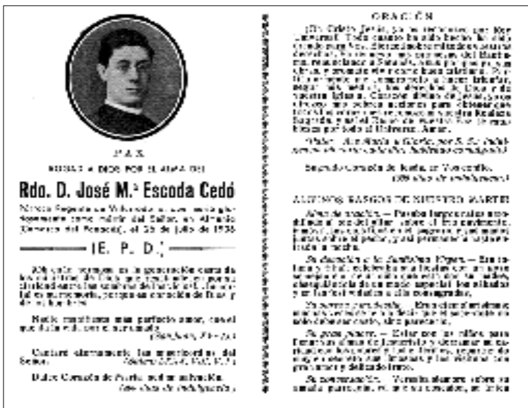
□ Recordatori del rector de Vila-rodon Josep M. Escoda Cedó, assassinat el 26 de juliol del 1936