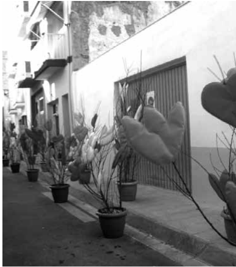
Carrer engalanat, 2009

veïns s'arreglen les cases i en pinten les façanes perquè facin més goig de cara als visitants.