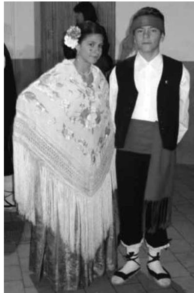
Parella de balladors, 2010

El xim-xim és el ball tradicional de la població d'Ulldecona. Aquesta jota ha anat canviant de festes, primer es ballava a la vuitada de Corpus; després, a les festes de Sant Lluç, i per últim, a les Festes Majors del poble. El ball es fa en tres dies: el primer, ballen els adults; el segon, els juvenils, i el tercer, els infantils. La Banda Municipal d'Ulldecona, juntament amb la Colla Gegantera i Grallers d'Ulldecona, acompanya els gegants anomenats Lluç i Pietat, els quals van vestits amb el vestit típic del xim-xim . Totes les parelles es dirigeixen cap a l'Ajuntament. És costum que el ballador passi a buscar la