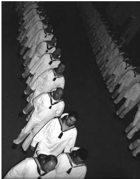
Quan els casencs van a buscar la Verge a Alcanar, 2009

El tercer dia després de la processó vénen casencs tots vestits de mariners, marcant el pas, per a agafar la Verge i emportar-se-la a les Cases d'Alcanar, és un moment molt emocionant, ja que hi ha gent d'Alcanar que fins i tot plora perquè se l'emporten.