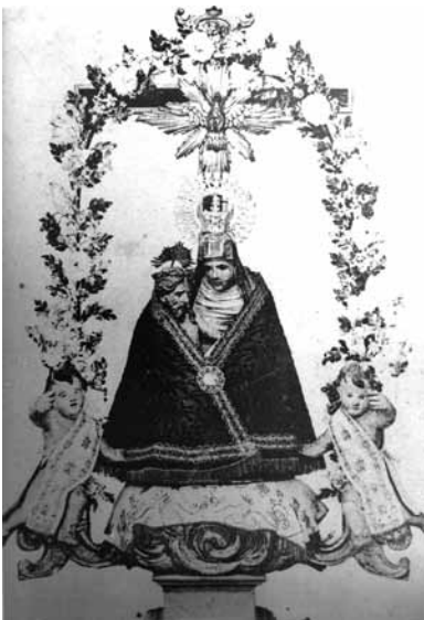
Mare de Déu de la Pietat abans de la Guerra Civil

Els àngels que actualment acompanyen la Verge van ser construïts el 1941.