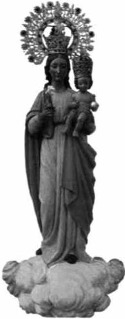
Escultura de la Mare de Déu del Remei