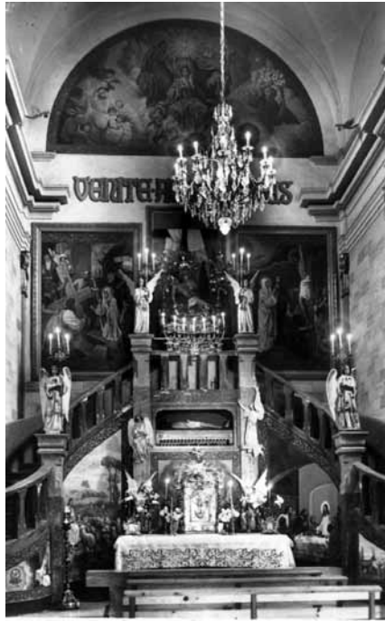
Milleana 18 Capella de la Iglesia parroquial Ede Domestis

Anaven de viatge a Barcelona i els que tenien més diners viatjaven a Mallorca.