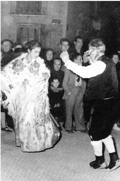
Parella de balladors, anys 60