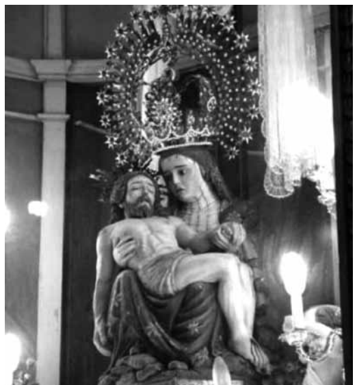
Mare de Déu de la Pietat actual