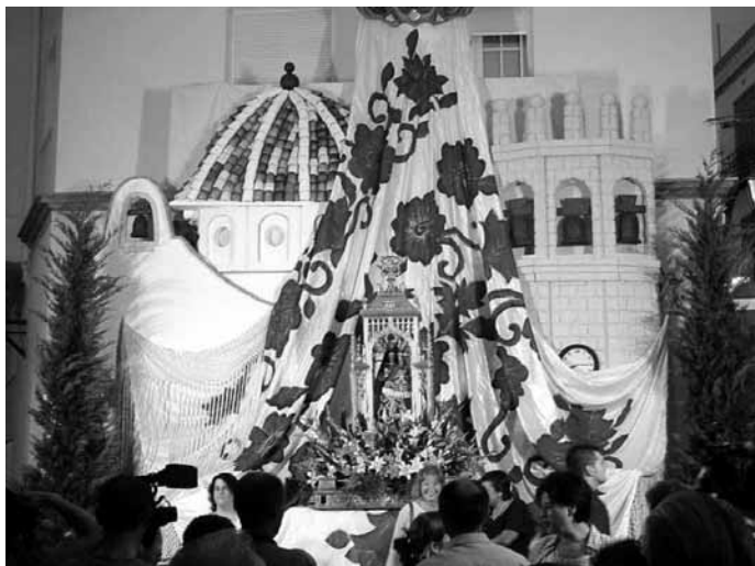
Altar on es deixa la Verge, 2009

a la població i baixen la imatge de la Verge del Remei a muscles els que aquell any compleixen 18 anys. Els canareus l'esperen a l'entrada del poble, l'aplaudeixen i li canten el goig.