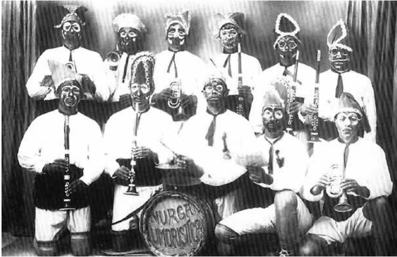
Grup de Carnaval anomenat La Murga