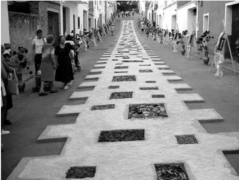
Carrer amb catifa, 2009

Totes les tardes dipositen la Verge a l'altar del sector fins a l'hora de la processó. Cada dia la imatge porta un vestit diferent i la gent del sector s'hi fotografia. Les catifes es construeixen durant el dia que ha de passar la processó a la nit i hi posen els diferents ornaments, al dia següent es lleva tot.