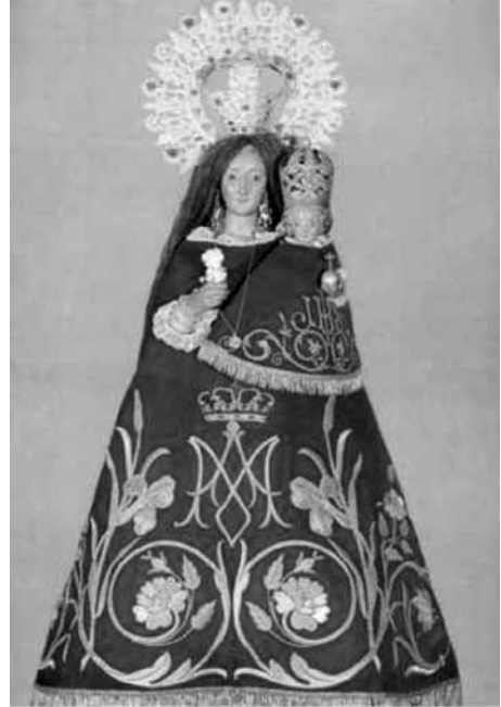
Mare de Déu del Remei vestida