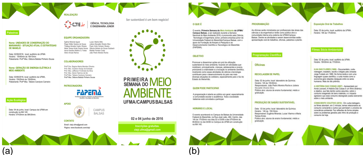
Figura 7. Folder da programação da I-SMA/UCB: (a) Página 01 e (b) página 02.