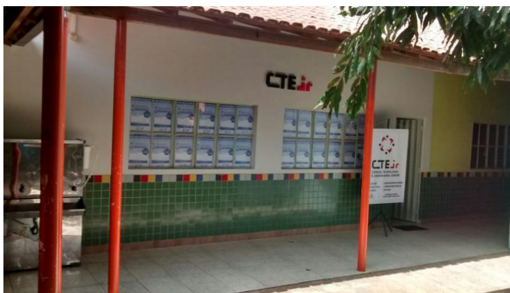
Figura 1. Sala da CTE Jr.

A CTE Jr. foi contemplada com a sala 06, sito à Rua José Leão, 484 – Centro – Balsas/MA. A Figura 1 mostra a sala com o letreiro do logo da empresa. O protótipo da sala criado com o software AutoCAD contribuiu no planejamento dos gastos com reforma e compra de materiais e no aspecto visual e funcional do espaço. Os bens patrimoniais adquiridos pela CTE Jr. são os seguintes: notebook , projetor, roteador, estante, rack , mesas, cadeiras, armário, telefone, quadro feltro, dentre outros materiais de escritório.