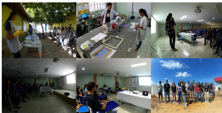
Figura 8. Mosaico de imagens das atividades realizadas na I-SMA/UCB.

A Terceira Mostra Científica da UFMA/Campus Balsas (III-MC/UCB), que ocorreu durante a Semana Nacional de Ciência e Tecnologia no período de 25 a 28 de outubro de 2016, contou com a ativa colaboração da CTE Jr., além da elaboração do vídeo de divulgação do evento, as demais atividades desenvolvidas foram oferecidas ao público em geral, compartilhando conhecimento e curiosidades e mostrando a importância do movimento júnior para sociedade, via dinamismo empreendedor. Na dinâmica das visitas no labirinto, montado dentro da sala da CTE Jr., cada grupo de visitantes teve acesso a quatro stands com exibição dos seguintes vídeos: “A história das EJs e da CTE Jr.”, “Horta submarina”, “Irrigação automatizada” e “Programa Scile2”. No quinto stand foi apresentado um time lapse referente ao nascimento e desenvolvimento de hortaliças, plantadas pelos alunos do Projeto CT Jr., as quais foram doadas durante o evento. A Figura 9 mostra um mosaico de imagens dos alunos nos stands da CTE Jr. durante a III-MC/UCB.