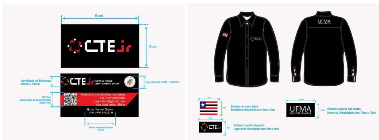
Figura 4. Ilustração do cartão de visita (à esquerda) e modelo padrão da camisa da CTE Jr. (à direita).

Na divulgação interna, a faixa com o logo da empresa foi fixada na sala da empresa e o banner publicitário (Figura 1) foi impresso, sendo frequentemente exibido em ocasiões como assembleias, palestras e oficinas. Na divulgação externa, visitas foram feitas tanto às empresas locais como à prefeitura e a secretarias municipais. O site, https://cteJr.wordpress.com/ , foi desenvolvido com base em aspectos técnicos que incluíram a linguagem PHP e protocolo HTTPS e no Linkedin foi criada uma página para cadastro de currículos dos alunos do curso e posterior direcionamento às empresas. O cartão e o uniforme da empresa foram confeccionados (Figura 4), entrevistas em canais de televisão local foram concedidas, um time lapse foi exibido no cinema local destacando o logo da CTE Jr., além de participação em mesa cerimonial de abertura da III-MC/UCB e apresentação de trabalho intitulado “Criação da Empresa CTE Jr.” no mesmo evento. A Figura 5 mostra o mosaico de imagens de algumas atividades de divulgação da CTE Jr.