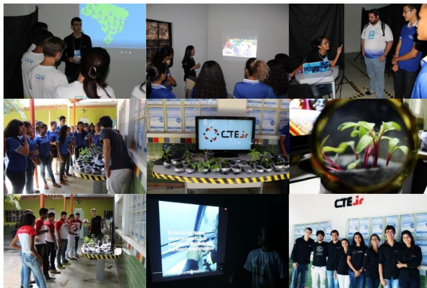
Figura 9. Mosaico de imagens dos alunos nos stands da CTE Jr. durante a III-MC/UCB.