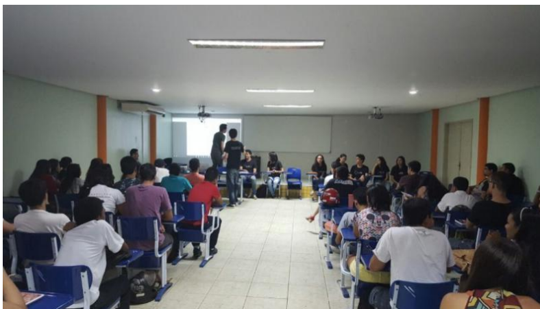
Figura 6. Assembleia geral dos alunos do curso ICT.