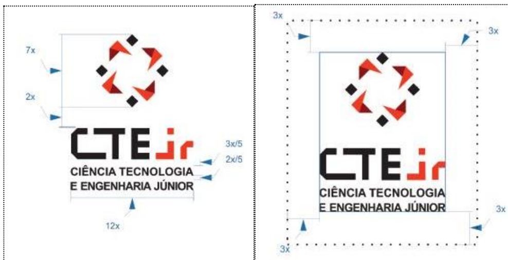
Figura 2. Medidas da marca (à esquerda) e da área de suspiro (à direita).

O logo criado foi inspirado em conceitos de movimento, transformação e inovação. A gestão de marca teve como princípio idealizador a forma de uma hélice, que pode ser associada a vários padrões na natureza e a peças presentes na maioria dos projetos de engenharia. A marca possui medidas que possibilitam a espaçamento dos elementos de forma simétrica e organizada (Figura 2).