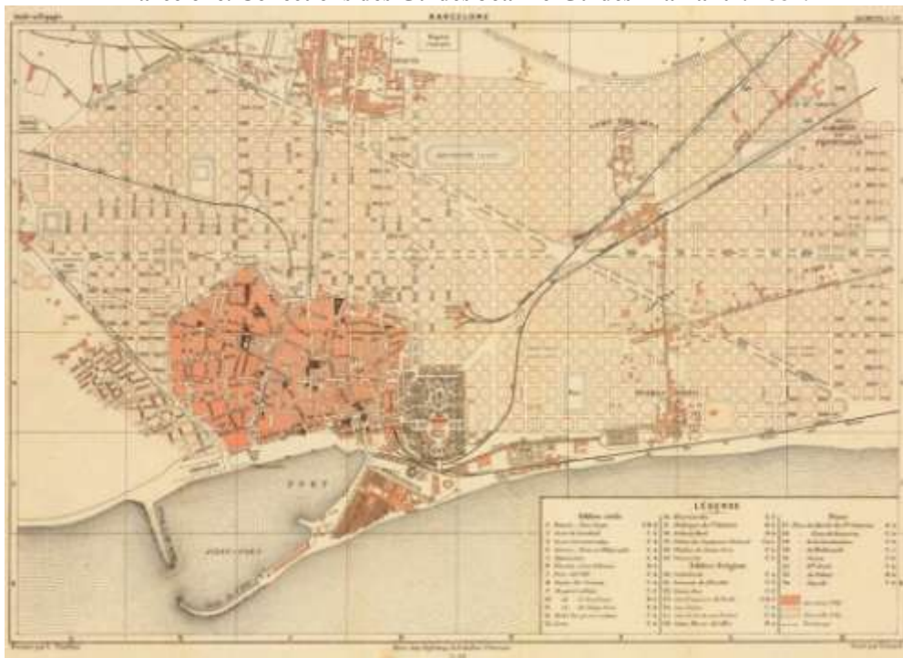
Figura 2. “Barcelone. Collections des Guides Joanne-Guides Diamant”. 1884.