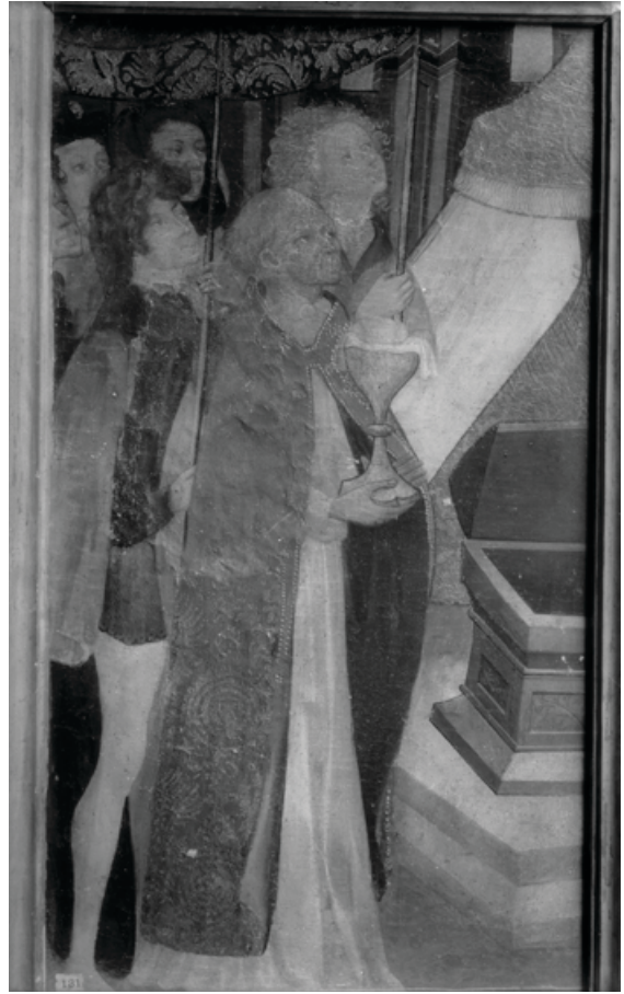
Fig. 12. Seqüència del miracle dels peixos. Retaule major d'Almàssera. Parador desconegut..

La imatge de la predel·la de Sixena no és l'únic testimoni medieval del miracle de l'hòstia rescatada pels peixos conservat a la corona d'Aragó identificat per la crítica. Post en publicà dues taules quatrecentistes al museu diocesà de València (núm. inv. 131-132), avui en parador desconegut, identificades com les úniques parts pervivents del retaule major de l'antiga església d'Almàssera (fig. 11-12). Segons s'ha dit, en elles s'hi representarien els peixos retornant l'hòstia de les aigües i la col·locació solemne de la forma miraculosa a l'església. De fet, igual que en el cas de Sixena, alguns historiadors han identificat el tema representat amb el miracle local dels peixets d'Alboraia, per bé que, almenys que jo sàpiga, la qüestió no ha estat estudiada amb profunditat. 40 Cal tenir en compte, tanmateix, que en la fotografia antiga de la primera taula (fig. 11) sembla que s'hi distingeixen uns personatges sobre una barca compatibles amb el llançament sacríleg representat en el mencionat retaule aragonès.