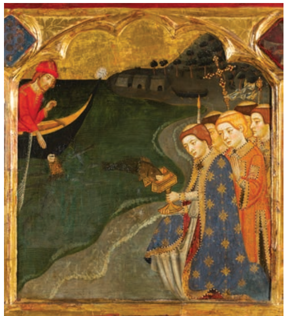
Fig. 10. Miracle dels peixos. Retaule de la Mare de Déu i l'eucaristia del monestir de Sixena. Barcelona, Museu Nacional d'Art de Catalunya, núm. inv. 15916-CJT.

Al costat del miracle de les abelles, el retaule de Sixena presenta encara una darrera història anàloga a les comentades, certament atractiva, que s'estructura en dues seqüències successives (fig. 10). D'una banda, un pescador des de dalt d'una barca es desfà d'una hòstia consagrada,