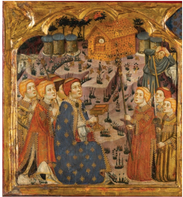
Fig. 8. Miracle de les abelles. Retaule de la Mare de Déu i l'eucaristia del monestir de Sixena. Barcelona, Museu Nacional d'Art de Catalunya, núm. inv. 15916-CJT. (© Museu Nacional d'Art de Catalunya, Barcelona, 2019).

En el compartiment de l'extrem esquerre de la predel·la eucarística de l'al·ludit retaule marià de Sixena es desenvolupa una altra història que presenta nexes evidents amb les imatges tractades fins aquí. El miracle en qüestió té lloc en un paisatge bucòlic on, enmig d'unes arnes, apareix un santuari de cera que allotja un altar i una sagrada forma miraculosa a sobre. Les abelles sobrevolen la seva creació mentre un camperol mostra el seu astorament tot duent-se les mans al cap. A primer terme, un grup de religiosos que han acudit fins al lloc en processó, tal i com denoten la creu processional, els bordons o les lluminàries, rauen agenollats davant del prodigi i un dels sacerdots manté oberta una píxide quadrangular en vistes a guardar-hi la relíquia. Com en tants altres casos, els elements que conformen l'escena, doncs, conjuguen el fet miraculós pròpiament dit, així com el seu posterior reconeixement per part de l'autoritat eclesiàstica (fig. 8).