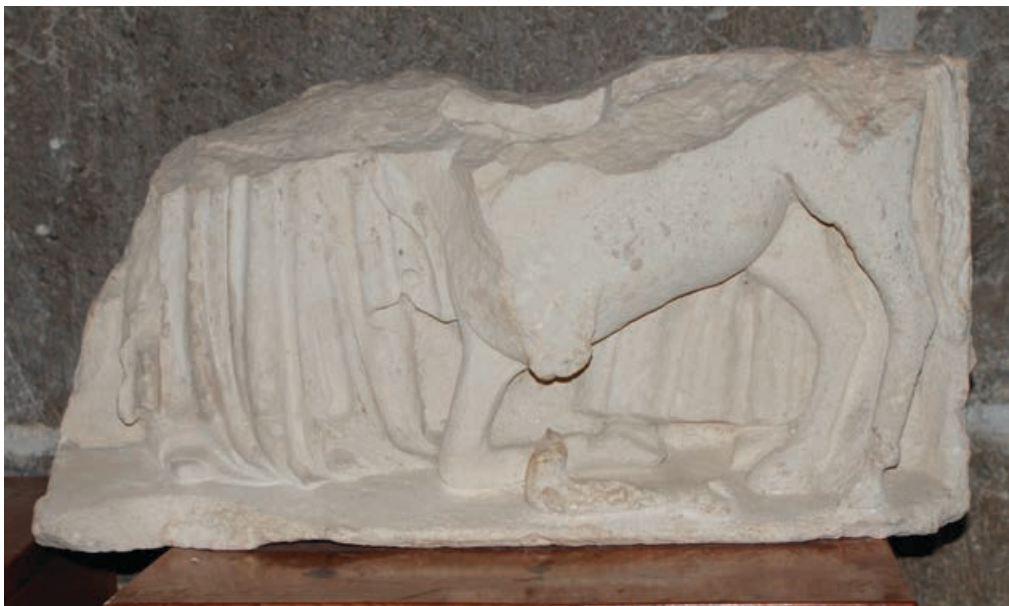
Fig. 4. Miracle de l'equí reverent. Retaule eucarístic de Sant Mateu. Col·lecció Museogràfica Parroquial de Sant Mateu. (foto: Cèsar Favà).