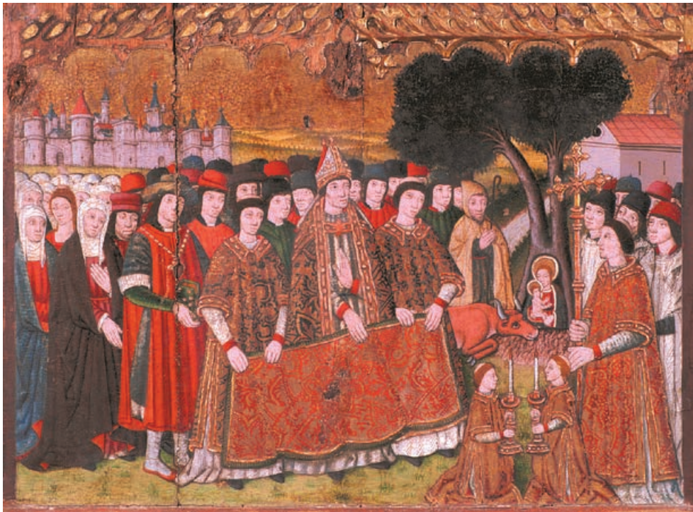
Fig. 1. Invenció de la MaredeDéu de la Bovera. Retaule de la Mare de Déu del santuari de la Bovera. Museu Episcopal de Vic, inv. 885 (© Museu Episcopal de Vic, fotògraf: Joan M. Díaz).

Lògicament, el paper dels animals en els miracles eucarístics és divers i concorda amb el caràcter absolutament polièdric que adopten en l'imaginari medieval i que, en determinats casos, fossilitza en les arts plàstiques. 5 Tanmateix, existeix una línia argumental que a l'època va gaudir d'una difusió generalitzada i que pot ser enquadrada en un marc ampli de prodigis determinats pels elements de la natura, com aquells en els quals l'hòstia surt indemne d'un aiguat o d'un incendi. 6 M'estic referint a aquells miracles protagonitzats per animals diversos que, malgrat la seva condició d'éssers irracionals, són capaços de reconèixer la presència divina en la sagrada forma consagrada i d'actuar en conseqüència, generalment retent-li culte de múltiples maneres. L' exemplum 352 de l' Scala Coeli de Jean Gobi Junior, que està basat en un dels relats eucarístics de Cesari d'Heisterbach, recull un cas que es pot prendre com a paradigmàtic, tant per la trama com perquè posa en solfa diverses espècies animals: la forma consagrada del viàtic cau al camp durant el seu trasllat i, en conseqüència, un grup d'animals diversos ( oves et boves, asini et equi , segons el text) es disposen en rotllana al seu voltant i li regalen una genuflexió. 7