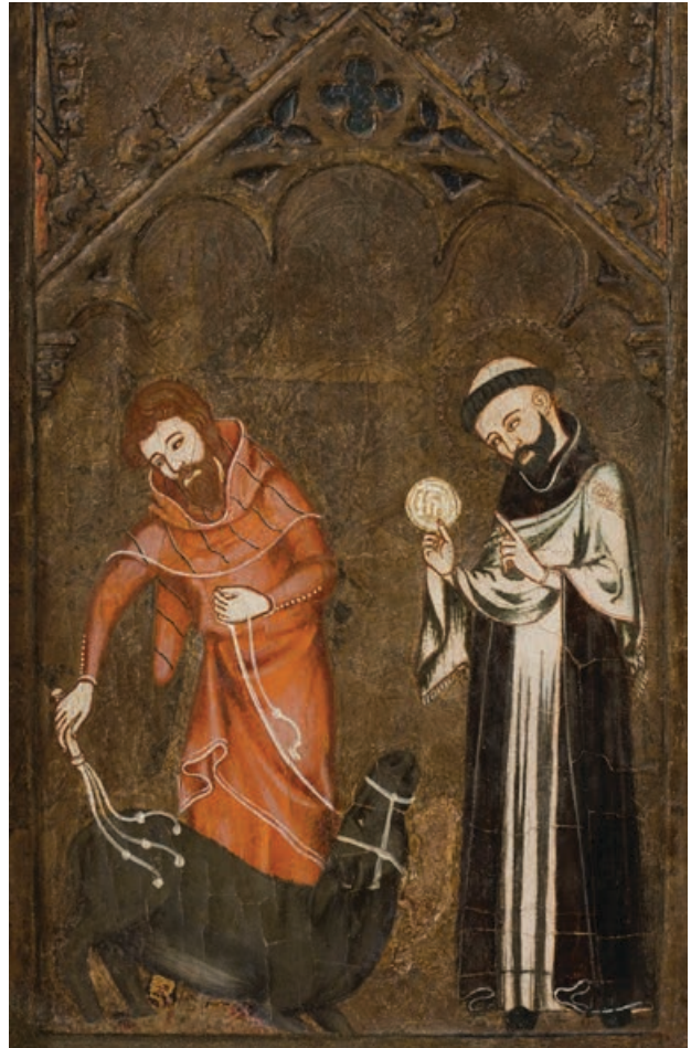
Fig. 2. Miracle de l'equí reverent. Retaule del Corpus Christi del monestir de Vallbona de les Monges. Barcelona, Museu Nacional d'Art de Catalunya, núm. inv. 9920. (© Museu Nacional d'Art de Catalunya, Barcelona, 2019).

El motiu de l'animal que fa una genuflexió a l'hòstia consagrada en reconeixement de la presència divina apareix en múltiples relats medievals, sovint amb variacions que no només afecten l'acció en la qual aquesta té lloc, les seves coordenades i els seus protagonistes, sinó que fins i tot freqüentment impliquen una fluctuació de l'espècie que hi pren part. A vegades pot ser una porcada la que s'agenolla davant una hòstia abandonada al camp, després d'haver estat robada; en altres, és una manada de llops la que es postra al seu pas durant el trasllat del viàtic, etcètera. 14 Com succeeix en la imatge de Vallbona de les Monges, sovint l'actitud pietosa de l'ani-