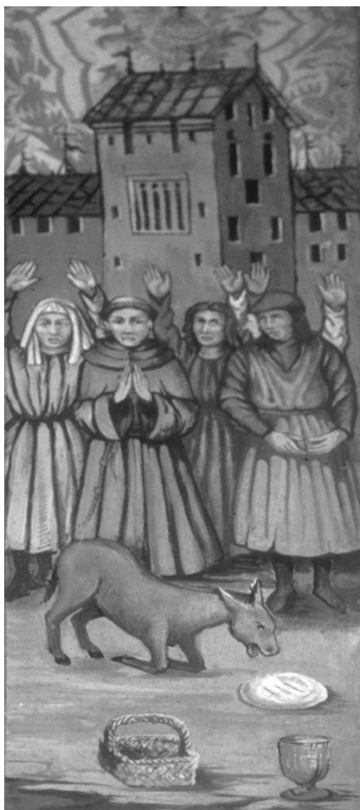
Fig. 6. Miracle de sant Antoni de Pàdua i la mula. Retaule de santa Anna de Fonts. Església parroquial de Fonts (Osca). (foto: Alberto Velasco).