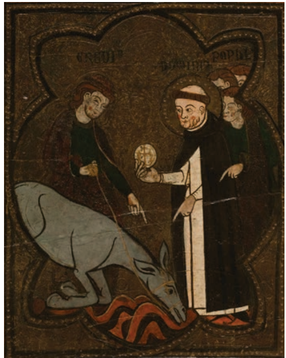
Fig. 3. Miracle de l'equí reverent. Taula de sant Domènec de Tamarit de Llitera. Barcelona, Museu Nacional d'Art de Catalunya, núm. inv. 15825. (© Museu Nacional d'Art de Catalunya, Barcelona, 2019).

Fins fa poc, la imatge del retaule de Vallbona de les Monges constituïa l'única figuració del miracle de l'equí reverent reconeguda en l'art hispà del cos de Crist. Amb tota probabilitat, però, n'ha perviscut parcialment una altra en un relleu escultòric provinent d'un conjunt desmembrat, també dedicat a l'eucaristia. Es tracta del fragment de la col·lecció museogràfica parroquial de Sant Mateu (Baix Maestrat) que, tot i que ja havia estat identificat lacònicament amb el miracle de l'equí, darrerament ha estat inter-