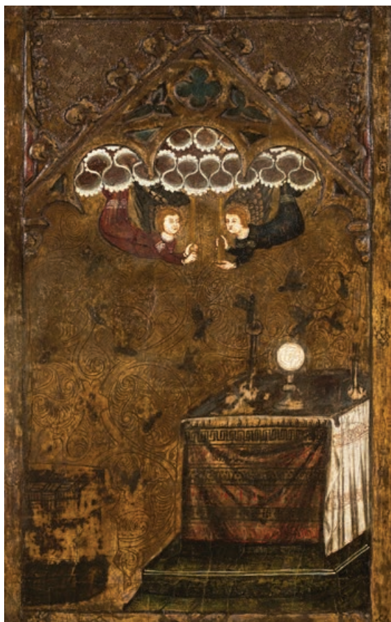
Fig. 9. Miracle de les abelles. Frontal del Corpus Christi del monestir de Vallbona de les Monges. Barcelona, Museu Nacional d'Art de Catalunya, núm. inv. 9919). (© Museu Nacional d'Art de Catalunya, Barcelona, 2019).

La composició del miracle de les abelles albergada en aquest frontal és tan sintètica que resulta impossible relacionar-la amb una versió determinada del relat. A banda dels insectes i del rusc, en efecte, únicament hi apareix un altar cobert amb un teixit que sustenta un ostensori flanquejat per dos candelers, el qual deu reflectir la construcció bastida per les abelles concebuda pel pintor. Completa