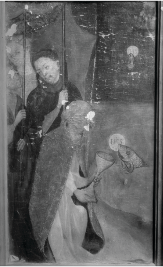
Fig. 11. Seqüència del miracle dels peixos. Retaule major d'Almàssera. Parador desconegut..