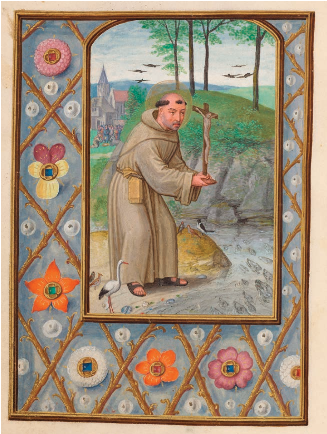
Fig. 5. Predicació de sant Antoni de Pàdua als peixos i miracle de la mula. Hores Da Costa . Nova York, The Morgan Library & Museum, MS M. 399, f. 308v.

En l'actualitat, el miracle de l'equí assignat al sant portuguès també apareix figurat en un altre retaule de la corona d'Aragó que no té una dedicació eucarística estricta. Aquest, en efecte, és contingut a la polsera de la dreta de l'espectador del retaule de santa Anna de Fonts (Osca), el qual, datat vers la darrera dècada del segle xv i assignat al Mestre de Viella, es conserva en l'actual església