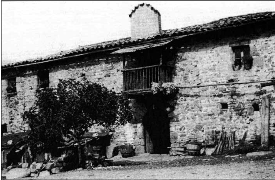
El mas Serrallonga l'any 1960, poc abans del seu abandó.