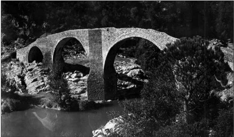
El pont de Querós, element cabdal del difícil sistema de comunicacions de la vall.

Serrallonga i la Querosa van passar a formar una mateixa propietat pels volts del 1537. Abans eren dos masos separats: en el període 1381-1387 el possessor del mas Serrallonga era Bernat de Serrallonga 20 , mentre que el de la Querosa era Pere Querosa, que sembla que encara ho era l'any 1405 21 . L'any 1532 documentem Joan Serrallonga, responsable de les obres de construcció del pont de Querós 22 . L'any 1537, en canvi, trobem que el mas Serrallonga el porta Salvi Querosa, àlies Serrallonga, casat amb Joana, molt probablement pubilla del mas 23 .