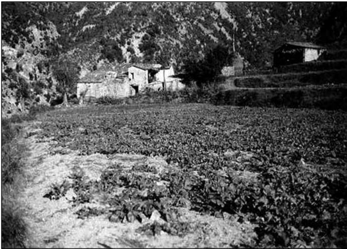
Imatge del Sangles a mitjan segle XX.