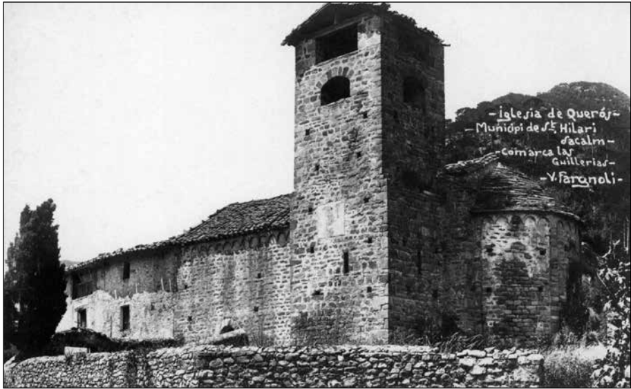
Església de Sant Martí de Querós.