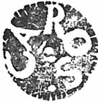
Segell municipal de Querós emprat l'any 1876.

l'any 1834. Amb 20 cases i uns 100 habitants, l'any 1845 aconseguirà sobreviure a la primera supressió de municipis petits gràcies a l'annexió de Mansolí 71 , tot formant així un municipi que s'estendrà també a l'altra banda del coll de Querós i que aplegarà finalment unes 35 cases i poc més de 200 habitants.