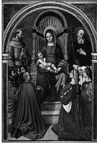
Una de les imatges conservades dels vescomtes de Cabrera i de Bas és a la pintura Madonna delle Grazie , a Alcamo (Sicília).