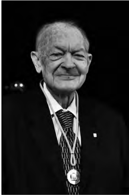
Fotografia oficial de l'entrega de la Medalla d'Or de la Generalitat de Catalunya.