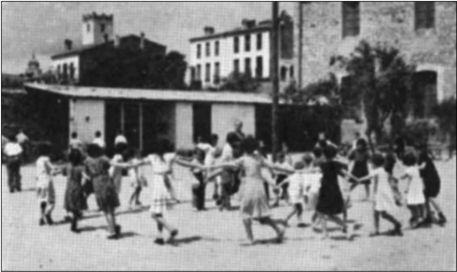
Infants de la Colònia García Lorca a Santa Coloma de Farners jugant al pati de l'actual guarderia infantil i aleshores col·legi de les monges del Cor de Maria.

Durant un temps, i malgrat la presència dels refugiats, el Balneari «Termas Orión» encara continuà funcionant com a tal i també com a lloc d'estiueig, tal com mostra la publicitat de l'establiment fins als acabaments de 1936.