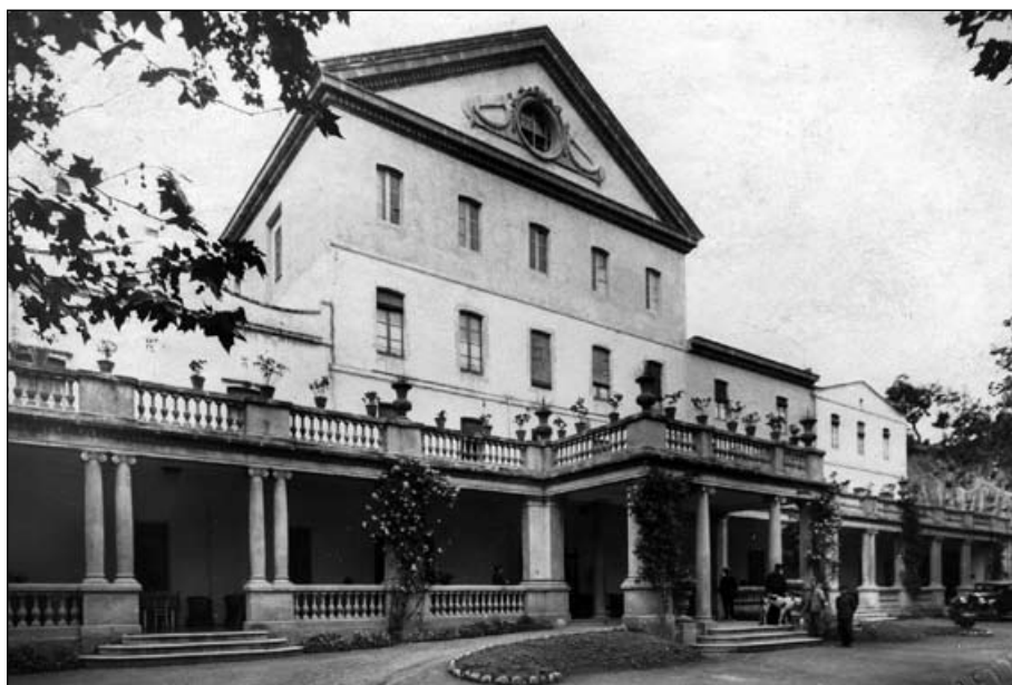
Entrada de les Termes Orion als anys 30.