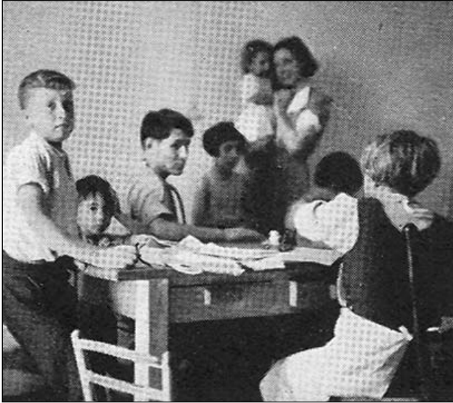
Revisió mèdica d'un grup d'infants de la Colònia García Lorca per part del personal sanitari de la Clínica Militar número 5.

queixa a la seu central de l'Agrupació d'Hospitals Militars de Girona perquè no es disposava d'aquest material, fins al punt que a l'agost s'ha de traslladar un ferit en ambulància a Girona per poder-li fer una radiografia.