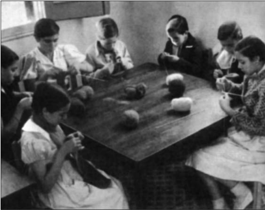
Grup de nenes de la Colònia García Lorca fent labors.

re. Arran d'aquesta denúncia, el 10 de juny es va demanar la construcció de dos dipòsits d'uralita d'una capacitat de 500 litres cadascun per a poder esterilitzar l'aigua corrent.