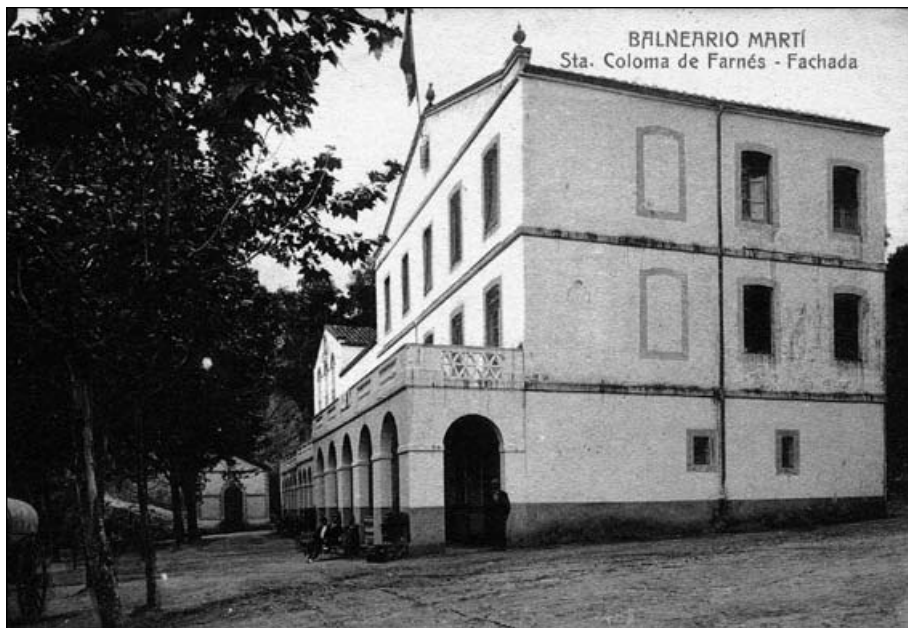
Imatge de l'antic Balneari Martí.