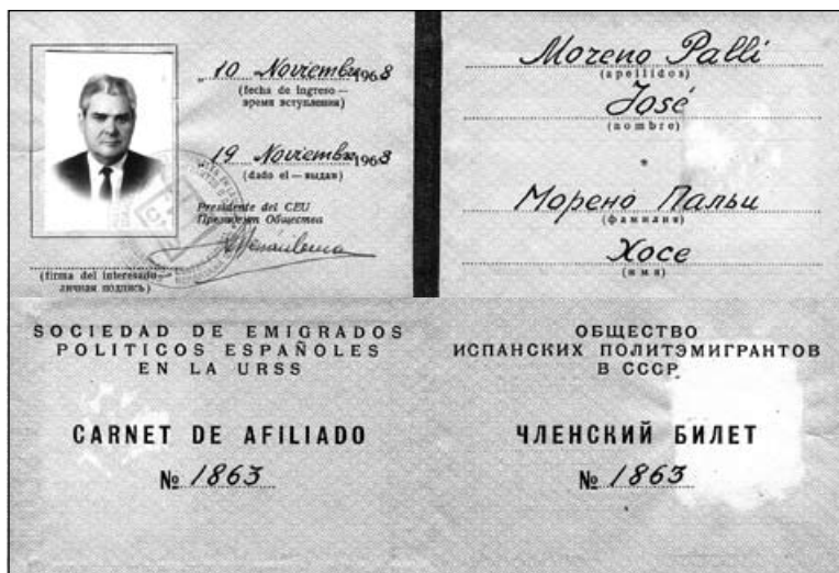
Carnet "Sociedad de Emigrados Políticos Españoles en la URSS".

sortir d'allà, vam travessar tota l'Àsia Central i vam anar a Sibèria», recordava el mestre amb precisió.