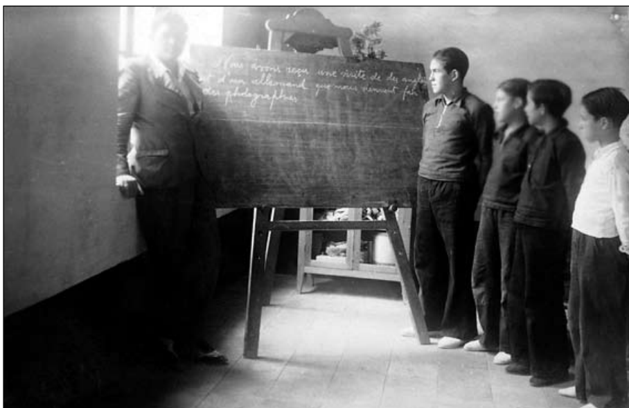
Fent classes a Tossa.