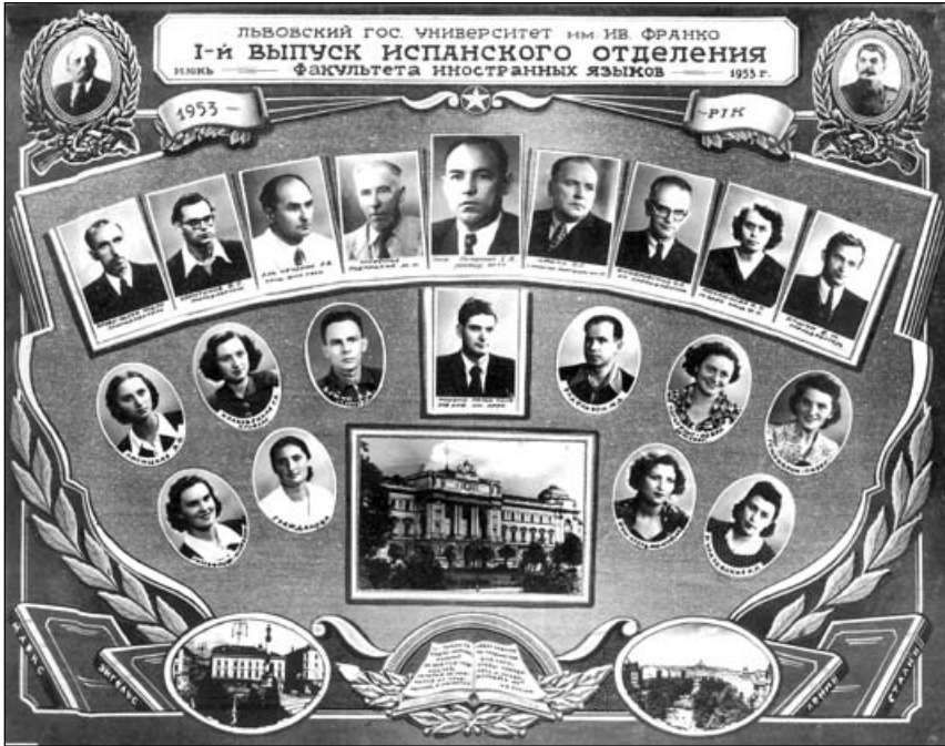
Orla Universitat Lvov (1953).