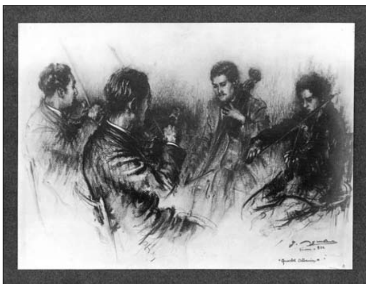
Dibuix del Quartet Albéniz.