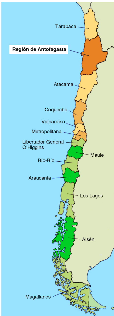
Gráfico 1. Mapa de Chile