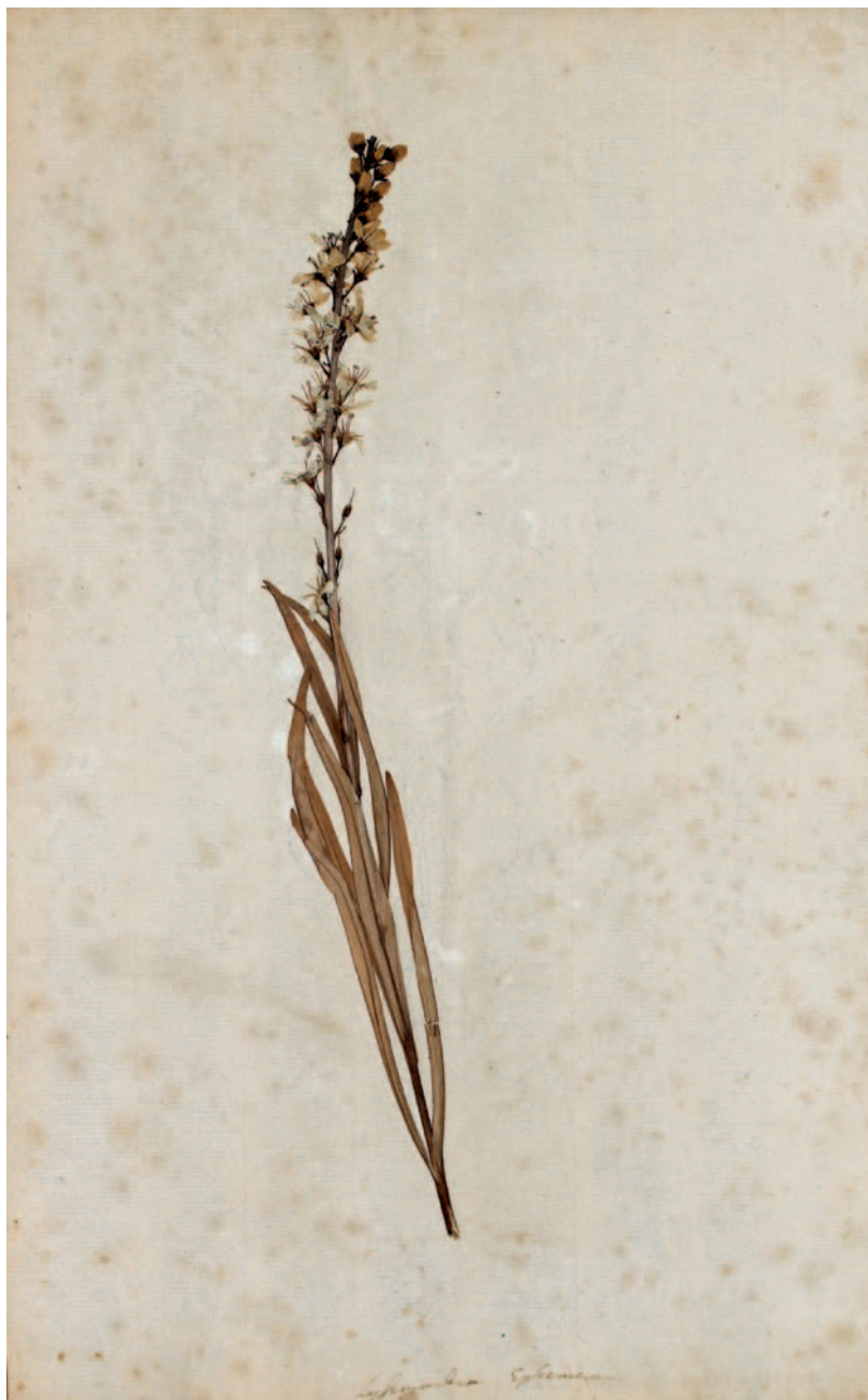
Figura 1. Material original de Linneo para la descripción de su Lysimachia ephemera , Herb. Linn. No. V-600929 (UPS-LINN).