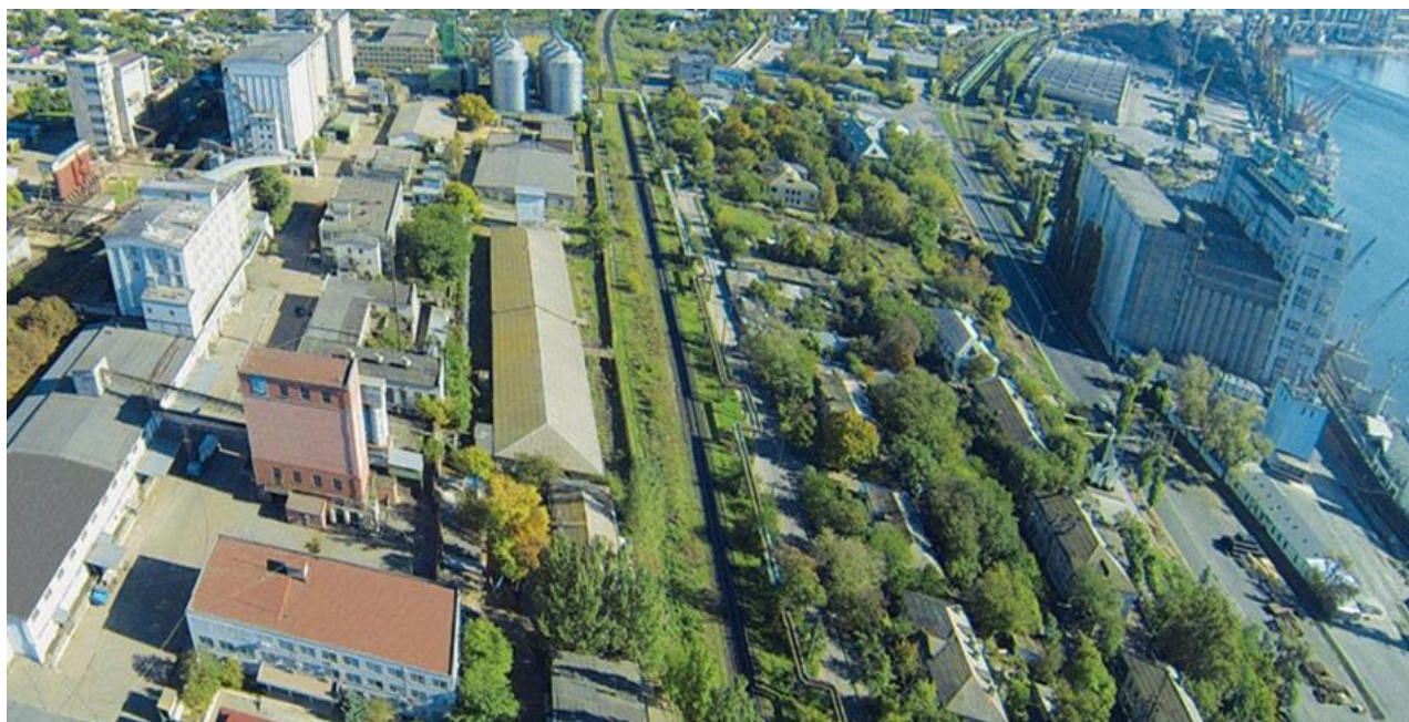
Рис. 2. Панорама об'єктів зернового терміналу компанії "Миколаївський комбінат хлібопродуктів"

е) підвищити, поступово через три роки, вантажообіг морського порту орієнтовно на 1800 тис. тонн на рік, збільшить кількість заходів суден на 156 одиниць на рік, що приведе до значного збільшення надходжень від портових зборів на причалі №10 не менше 50,987 млн. грн. в рік, від послуги доступу портового оператора до причалу №10 додатково мінімум 6,552 млн. грн. в рік, відрахувань у державний бюджет не менше 33,749 млн. грн. щорічно.