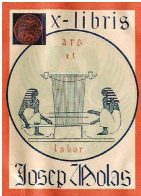
Figura 8. Ex-libris de Josep Molas, 1914