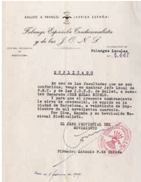
Figura 4. Nomenament de Josep Molas com a cap de FET y JONS a Mollet del Vallès, setembre de 1940.