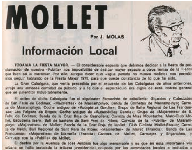
Figura 6. Capçalera de la crònica setmanal que publicava al setmanari Vallès, 1976

cosins i que llegia amb motiu d'aniversaris, onomàstiques i altres festes i celebracions. Els escrivia i els recitava als àpats amb familiars i amics, tal com es pot veure a la seva documentació personal. Ja hem comentat abans que als anys vint i trenta participava activament en la redacció i confecció de diverses publicacions de l'àmbit industrial tèxtil. El 1914 va començar a escriure i publicar a les revistes Juventut Tèxtil , que el 1917 es va transformar en Industria Textil , de la qual era el coordinador. El 1928 va iniciar la seva col·laboració periodística amb El Dia de Terrassa . I a partir del 1931 amb la revista Pàtria de Manresa 38 , a més d'altres publicacions de Sabadell, Mataró i Reus. En aquella època les seves cròniques giraven sempre al voltant del món del treball i les indústries tèxtils, tan importants en l'economia catalana. A la postguerra va participar activament també en la revista "T" que tractava, és clar, temes del tèxtil.