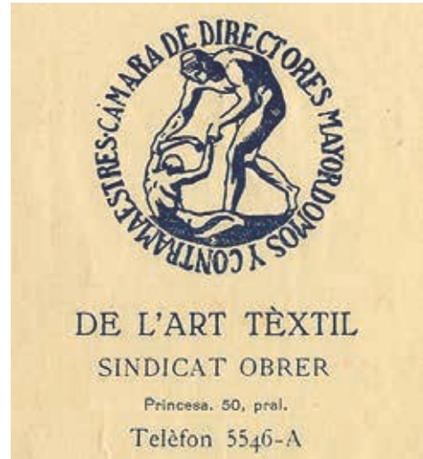
Figura 3. Logotip de la Cambrà de Directors i Majordoms de l'Art Tèxtil, de la qual Molas va ser president molts anys.

nostre biografiat es feia gran. Els avenços tècnics i la mentalitat dels nous temps van fer que els propietaris nomenessin un altre director tècnic i ell va anar-se dedicant a tasques més socials i representatives en nom de Sederías Fàbregas. Es va jubilar oficialment l'agost de 1967, als 70 anys, després de 38 de servei a l'empresa 13 . No obstant això, i almenys fins el 1975, va continuar anant sovint a la fàbrica, ja que es conserven documents que proven que encara feia gestions per a l'empresa malgrat estar teòricament jubilat.