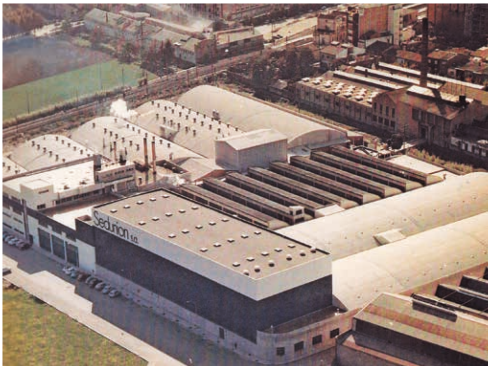
Figura 17. Vista aèria de la planta de Sedunion que ocupava una superfície edificada de 25.000 m 2

A l'empara del III Pla de Reconversió Industrial, que donava grans facilitats fiscals, es projectà una nova fàbrica de 25.000 m 2 . La inversió total va ser de 500 milions de pta. La nova planta es va situar en uns terrenys emmarcats per la riera Seca, la ronda d'Orient, carrer de la Riera i el torrent Caganell. S'hi va construir una gran nau per al tissatge, el tint, els acabats i l'estampació i un gran magatzem. Al mateix temps, es va construir un edifici de tres plantes destinat a oficines, vestidors, menjador i magatzem. Es va dur a terme la total automatització de la fabricació i la producció va passar a ser controlada informàticament. També es van adquirir el telers sense llançadora MAV i DORNIER, maquinària d'alta velocitat informatitzada i es van ampliar els torns fins a un 4t i un 5è.