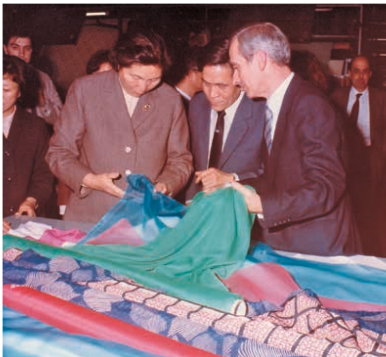
Figura 18. Chen Muhua, consellera d'Estat i Ministra de Relacions Econòmiques i Comerç amb l'Exterior de la República Popular de la Xina visita Can Fàbregas el gener de 1985