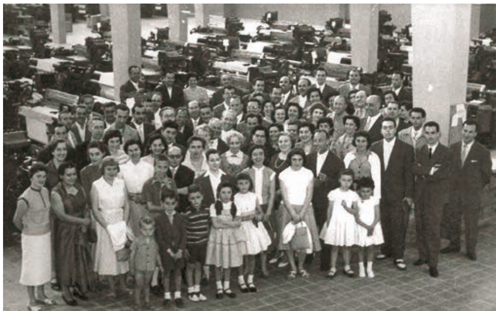
Figura 8. Inauguració de la sala nova, any 1958