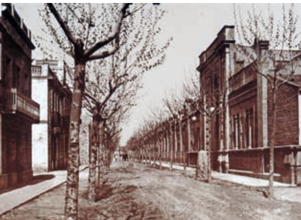
Figura 1. C/Berenguer III sense urbanitzar, amb l'edifici de Can Fàbregas a la dreta

El nom del fundador, Gaietà Fàbregas Rafart, es va inscriure en un lloc destacat de la façana i avui és pràcticament l'únic que resta en peu de la fàbrica. Gaietà Fàbregas (1849-1930) era un home emprenedor, entusiasta i amb ganes d'innovar. El 1903 i el 1905 marxà en una expedició com a representant del Col·legi d'Art Major de la Seda, a les repúbliques d'Argentina i Uruguai per cercar nous mercats d'exportació per a la seda espanyola. El resultat d'aquests viatges es va valorar positivament, en considerar que van reactivar la indústria tèxtil sedera espanyola. Per explicar amb detall aquestes expedicions, Gaietà va publicar dos llibres, dels quals reproduïm uns fragments 5 .