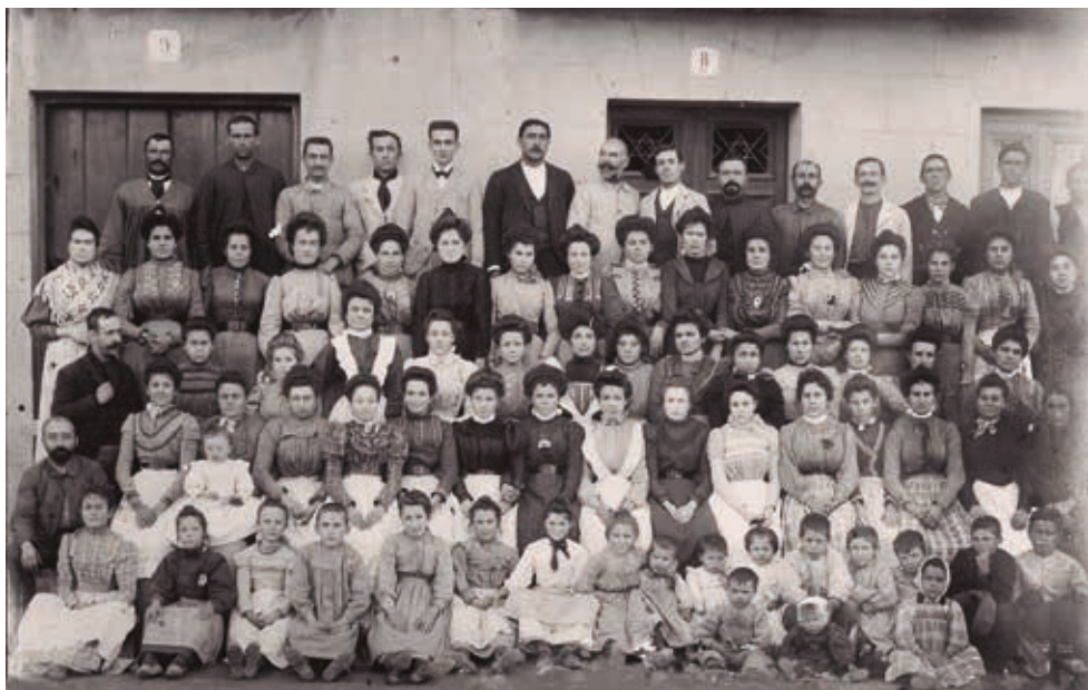
Figura 2. Grup de treballadors de Can Fàbregas als inicis del segle XX

ta à la magnífica fàbrica de sederías de don G. Fàbregas y Rafart.