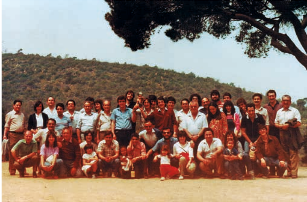
Figura 21. Grup de treballadors a la font dels Castanyers, després del partit de futbol a les Pruneres entre els de la secció d'Estampació contra els del Tint. El que guanyava s'emportava una copeta. Any 1982