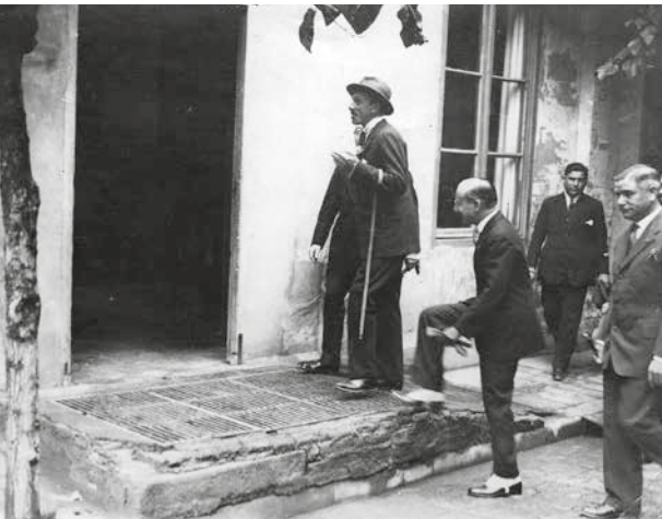
Figura 3. Visita del Rei Alfons XIII a Can Fàbregas

es vesteix de gala, s'organitza una exposició de mostres a l'interior i a les treballadores se'ls reparteix un davantal i unes falses mànigues de color blanc com a uniforme, per rebre el monarca. La família Fàbregas en ple assisteix a la rebuda del rei: