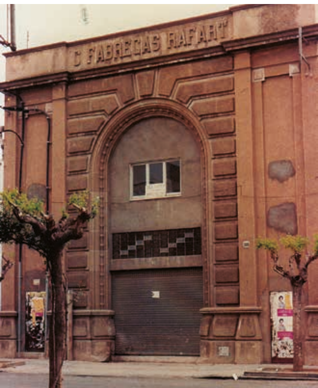
Figura 20. L'únic testimoni que es conserva de l'esplendorosa fàbrica de Sedunion és aquesta portalada amb el nom del fundador a la part superior de la façana