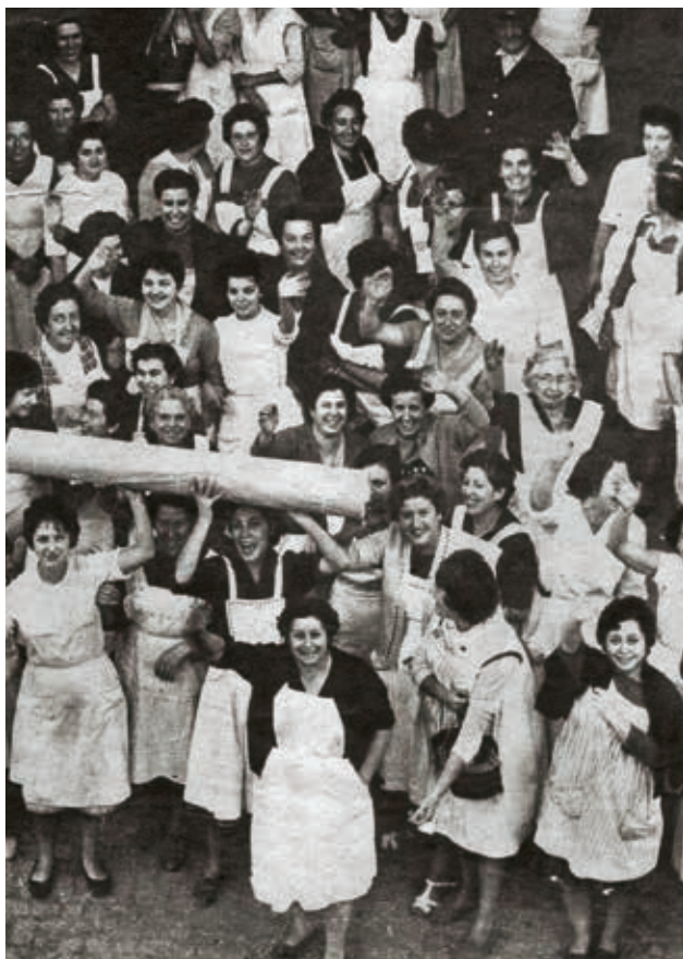
Figura 12. Teixidores de Can Fàbregas amb el paquet del 9 kg. i mig amb la roba de la reina Fabiola

riment, el Col·legi de l'Art Major de la Seda va demanar al famós modista Cristóbal Balenciaga, encarregat de confeccionar el vestit de Fabiola, que triés la roba entre totes les cases sederes. Balenciaga va escollir un ras sarga blanc marfil de les Sederies Jorge Fàbregas i va demanar 30 metres de roba d'un pes de nou quilos i mig. El pressupost del vestit s'havia acordat que es pagaria entre tots els seders d'Espanya.