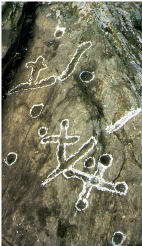
Figura 4. Pedra-1 del Puig Margall-I (Port de la Selva, Alt Empordà), amb els gravats de cassoletes, reguerons i antropomorfs (Gesart, 1992).

El grup de les 6 esteles amb banyes, fetes sobre gres, dues de senceres i 4 de trencades, de la Serra del Mas Bonet (Alt Empordà), localitzades l'any 2008, és també molt interessant (Riba, Rosillo i Palomo, 2010). En aquest cas, es tracta d'unes esteles amb figuració