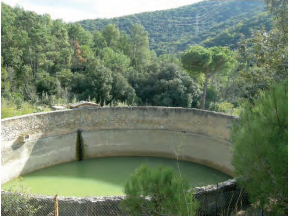
Figura 10. Bassa de can Girona

A la mateixa horta de can Matons hi ha dues zones o hortes separades pel torrent. A l'altra banda d'aquest, trobem una sínia o bassa rectangular que s'abasteix de la mina adjunta accionada amb bomba, que serveix per regar els horts d'aquesta zona. La bassa deu tenir de 10 a 12 m 3 de capacitat.