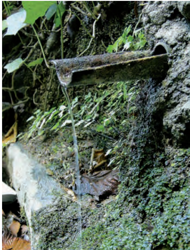
Figura 4. Font de la Teula