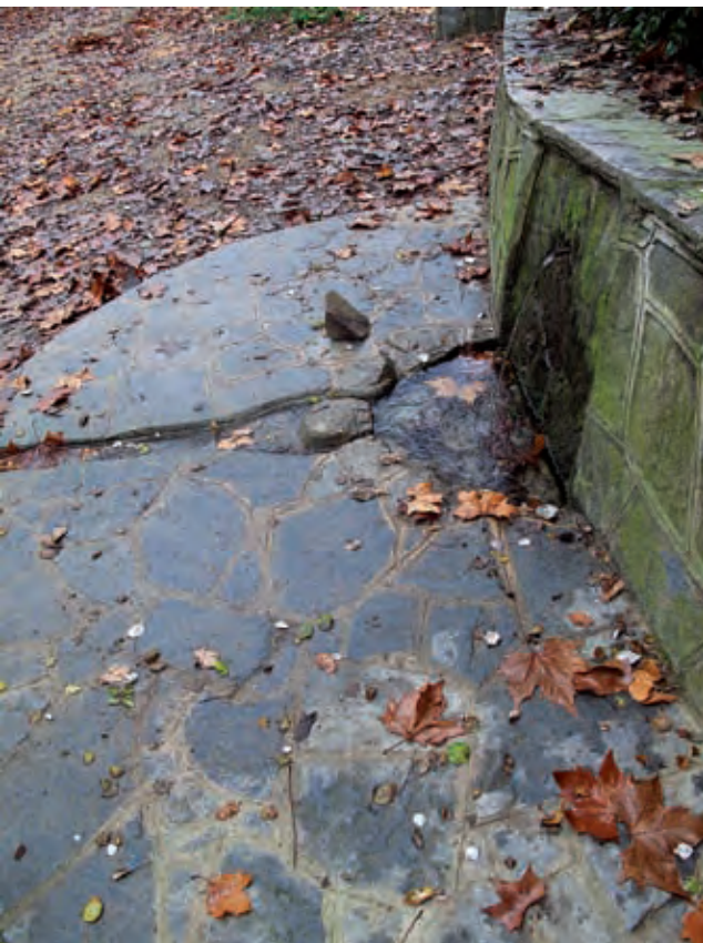
Figura 5. Font de la Mercè

L'anomenada Bassassa no es pot considerar una font pròpiament dita, tot i que és un element amb caràcter de surgència hidrològica. Es tracta d'una bassa d'aigua enclotada que s'omple d'una surgència i que devia servir per refrescar les carboneres o per regar els horts que trobem més avall, com es fa actualment. Consta d'un sot excavat al sòl de 15,5 m. de llarg, per 2,5 d'ample i un metre aproximadament de profunditat. L'aigua queda retinguda per una resclosa feta en forma de mur edificada en pedra tallada i morter, del qual surt una mànega de polietilè que duu l'aigua pendent avall.