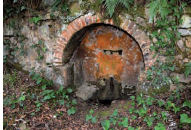
Figura 8. Font del Ferro

roca mare són la font del Racó a can Girona, de la Teula, la Beu-i-Tapa, i la Bassassa. Les altres (les de la Mercè, can Ros i can Rosanes), com hem dit, ragen d'una sèquia.