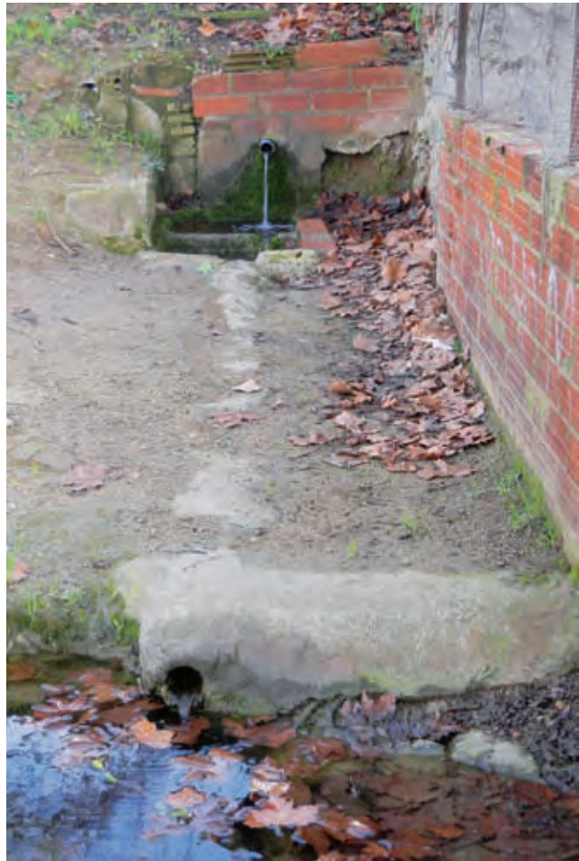
Figura 7. Font de can Matons

hi ha una font activa, encara que en estat de semiabandonament, situada en el torrent de Llicorelles amb la confluència de la carretera. Es tracta de la font de can Camp, amb referències de ben antic, i que ha sofert modificacions al llarg del temps. Baixant al torrent o barranc que trobem en aquest indret, veiem un pontet d'obra amb barana de ferro que passa pel damunt del torrent des del carrer d'Anselm Clavé de Martorelles, construït durant la II República. L'espai de la font constava d'una construcció senzilla amb