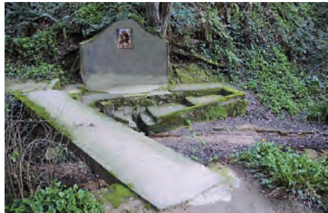
Figura 9. Font de can Roda

l'antic pont sobre el Besòs, i el tub-aqüeducte, i perquè l'abastiment de l'aigua de la Xarxa ATLL era de més qualitat i quantitat. El 2001, l'Ajuntament de Mollet va cedir tota la xarxa al de Santa Maria de Martorelles; ara només subministra aigua no potable a la font de can Matons, 1.200 m avall, per regar els horts que hi ha en aquell indret.