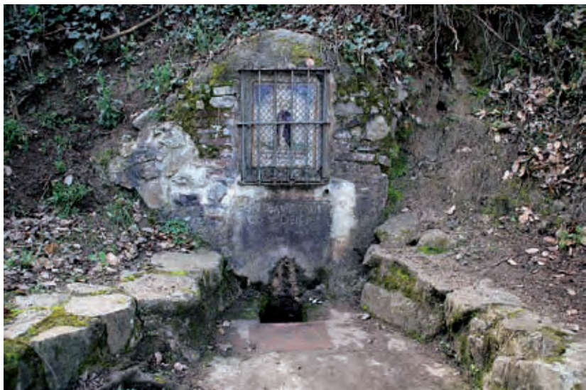
Figura 1. Font del Ca i de Sant Domènec

La presència d'aigua en relativa importància és cabdal per al manteniment del tipus de vegetació que proporcionen els recursos fusters i agrícoles concrets, però també per al benestar dels agricultors i treballadors rurals. Un altre aspecte important és la importància del medi físic en les comunicacions. Martorelles, malgrat l'orografia de muntanya i costeruda juga un paper de comunicació entre la costa, l'interior prelitoral i els mateixos pobles i masies d'una banda i l'altra de la serralada. Aquest fet, durant el passat i fins que es van construir les carreteres entre la costa i l'interior, comportava que la població que vivia a la serra utilitzés els camins per anar d'un poble o d'una masia a l'altra passant pel bosc i que fos freqüentat diàriament per nombroses