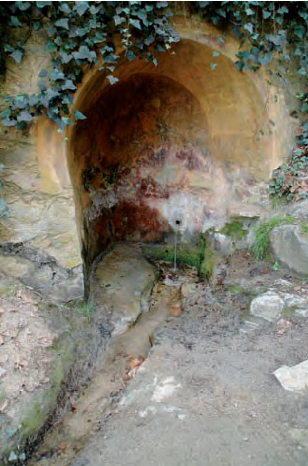
Figura 6. Font Sunyera

una construcció senzilla, encara que el pas del temps i la deixadesa potser l'han desmillorat.