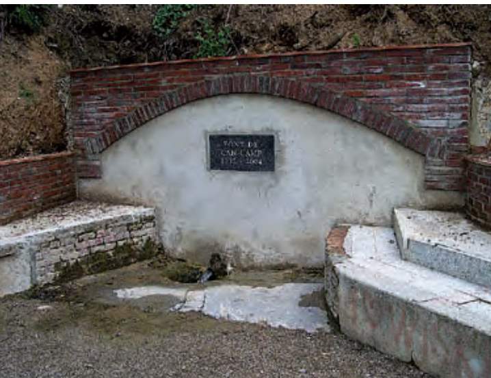
Figura 2. Font de can Camp

El granit és una roca ígnia, formada pel refredament lent d'una massa de magma provinent de grans profunditats, sotmesa a una gran pressió. El granit que nosaltres observem s'ha emplaçat en forma de batòlit, és a dir, com a una gran massa magmàtica que intrueix a