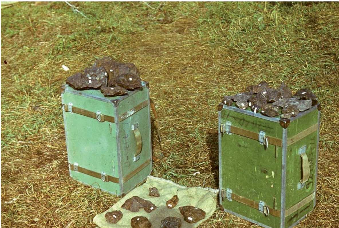
Рис. 7. Зразки метеорита Чінге, які були зібрані в експедиційний період у 1981 р.