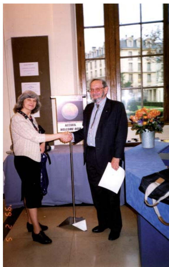
Рис. 4. Відомий космохімік професор Дж. Вассербург (США), який упродовж 1991—2002 рр. за власний кошт виписував і направляв на наш відділ коштовну щорічну підписку на журнал «Meteoritics and Planetary Sciences». Міжнародний симпозіум з вивчення Марса, Париж, 1999 р.

Слід зауважити, що особливе значення для розвитку космічної мінералогії в Україні мали наукова і фінансова підтримка відділу відомими закордонними дослідниками К. Пероном (Франція), Є. Ярошевичем, Г. МакФерсоном і Дж. Вассербургом (рис. 4) (США), А. Бішофом і Е. Єсбергером (Німеччина), С. Рассел (Велика Британія), а також спільні з ними дослідження рідкісного за своїми характеристиками українського метеорита Кримка в лабораторіях Франції, Німеччини (рис. 5) і США за такими науково-дослідними проектами: INTAS 93-2101(1.06.93—30.11.96) та INTAS 93-2101 Ext.