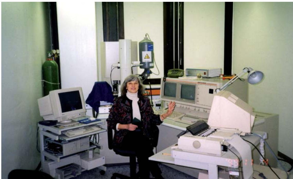
Рис. 5. Мікросондове дослідження метеоритів в Інституті планетології. Німеччина, Мюнстер, 2001 р.

Чи є у відділі проблеми? Звичайно є, причому хронічні. Перша з них — інструментальна база, друга — кадри, тобто відсутність істинного інтересу у молоді до наукової роботи. Матеріально-технічне забезпечення відділу явно не відповідає поставленим завданням дослідження. У період перебування в ІГНС НАН України відділ був ініціатором і промоутером в отриманні низьковакуумного електронного мікроскопа JSM-6490LV фірми JEOL (Японія) з енергодисперсним спектрометром OXFORD INCA Energy 350, використання якого впродовж 7 років сприяло проведенню тонких досліджень метеоритів. На цей час у відділі є лише оптичні мікроскопи і хімічна лабораторія, а мікросондові та електронномікроскопічні дослідження здійснюють на сучасній інструментальній