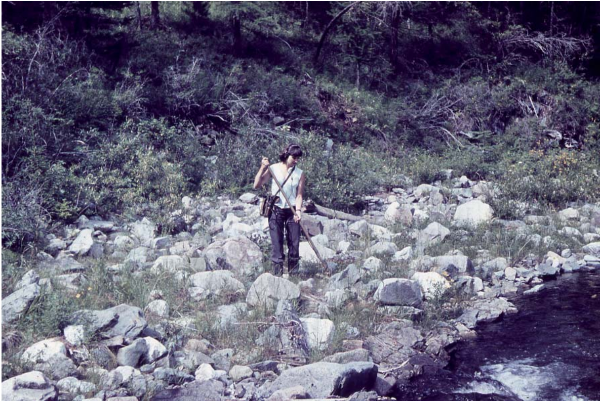
Рис. 6. Пошук зразків залізного метеорита Чінге в долині р. Чінге за допомогою міношукача. Тива, 1979 р.