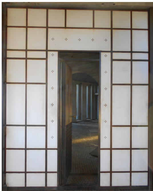
Figura 5. Tomba Brion , porta d'ingresso alla cappella. Cimitero di San Vito d'Altivole, Treviso.

quadratini più piccoli (figura 4) 36 . Lo stesso modulo si ritrova ancora nella decorazione della fioriera che galleggia nel silenzio della grande vasca, all'interno del complesso monumentale della Tomba Brion, presso il Cimitero di San Vito d'Altivole, vera e propria «summa» della produzione del grande architetto veneziano. E ancora alla definizione delle coordinate essenziali di ascendenza mondriana rimanda il disegno della porta che immette nell'incantata cappella dello stesso complesso, realizzata in gesso bianco lucidato, riquadrato da un'intelaiatura metallica e disposta secondo una geometria dalle partiture bidimensionali; una porta in «stile Mondrian» come l'aveva battezzata lo stesso Scarpa (figura 5) 37 .