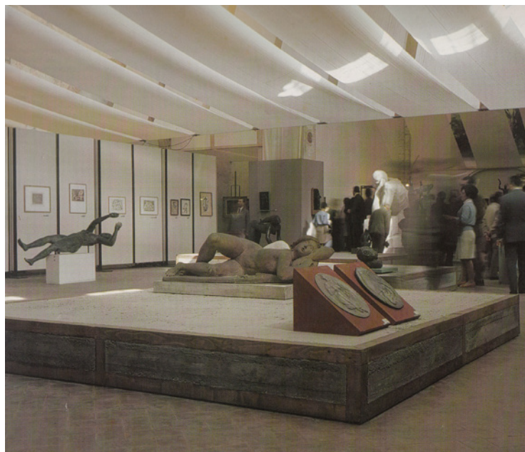
Figura 6. Mostra Arturo Martini, Treviso, 1967.

in dialogo perpetuo con l'ambiente. Una densità di esperienze che Carlo Scarpa percepiva come naturali e spontanee ma che, come sottolinea acutamente McCarter, appaiono «largely absent from most Modern architecture» 38 .