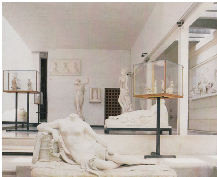
Figura 1. Gipsoteca Antonio Canova, Possagno.

Sempre rimanendo in tema di supporti, la galleria dei progetti più belli e originali è senza