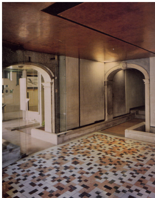
Figura 3 Fondazione Querini Stampalia, Venezia

L'allestimento della mostra significò per Scarpa la possibilità di poter studiare direttamente la logica e i ritmi dei dipinti dell'artista olandese, ripensando al cammino del pittore