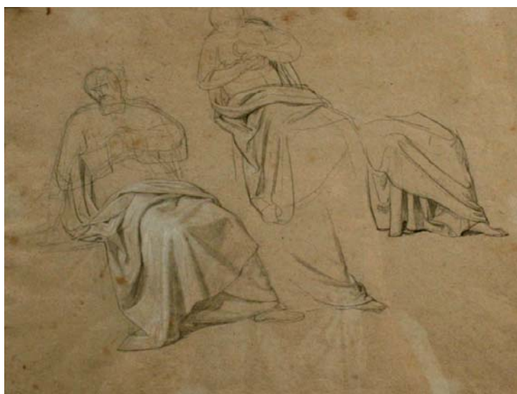
Figura 9. Pelegrí Clavé. Estudi de figura . Carbonet sobre paper, 28 x 37 cm. Museu d'Art de Girona.