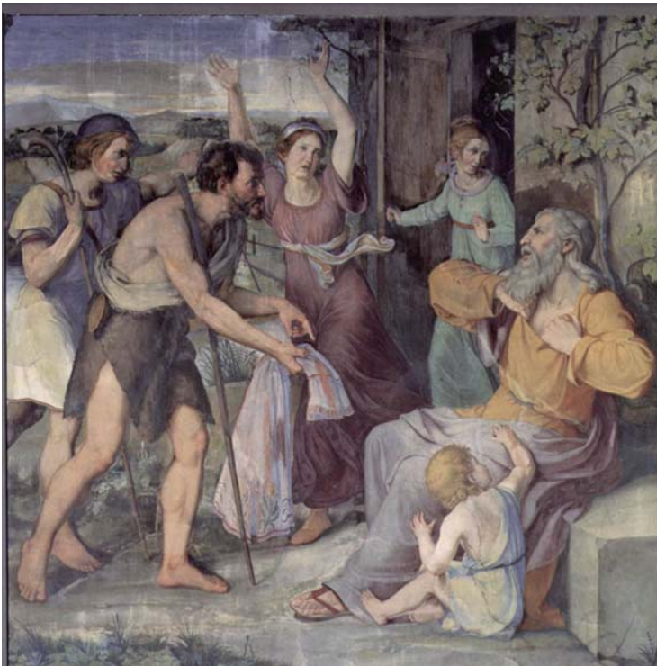
Figura 1. Frederich Wilhelm Schadow. Jacob rep la túnica ensangonada del seu fill Josep (Gen 37, 33-34). 1817. Fresc, 235 x 234 cm. Alte Nationalgalerie, Berlín.

cantar per la història bíblica de Josep a Egipte. L'obra va ser executada entre 1816 i 1817 i va tenir un resultat desigual, per raó dels diferents artistes que hi van intervenir (Overbeck, Cornelius, F. Wilhelm Schadow i Philipp Veit). Les intervencions d'Overbeck i Cornelius van destacar sobre la resta, i van quedar ben clares les diferències entre els seus estils: el més suau d'Overbeck, que buscava sobretot fer reviure l'art del primer Rafael, de Perugino i Pinturicchio, contrastat