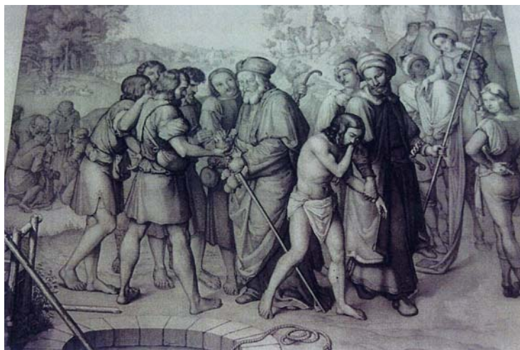
Figura 3. Gravat a partir de Friedrich Overbeck, Josep venut pels seus germans . Litografia, 89,3 x 61,5. Academia de Bellas Artes de San Carlos, Mèxic, inv. núm. 640305 (González 1992 p. 717, n. 217).