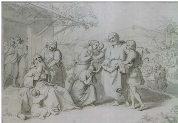
Figura 4. Pelegrí Clavé. Jacob s'arrenca els vestits en veure la túnica de Josep . Dibuix al llapis. Loc. desconeguda (González 1992, p. 701, n. 74).