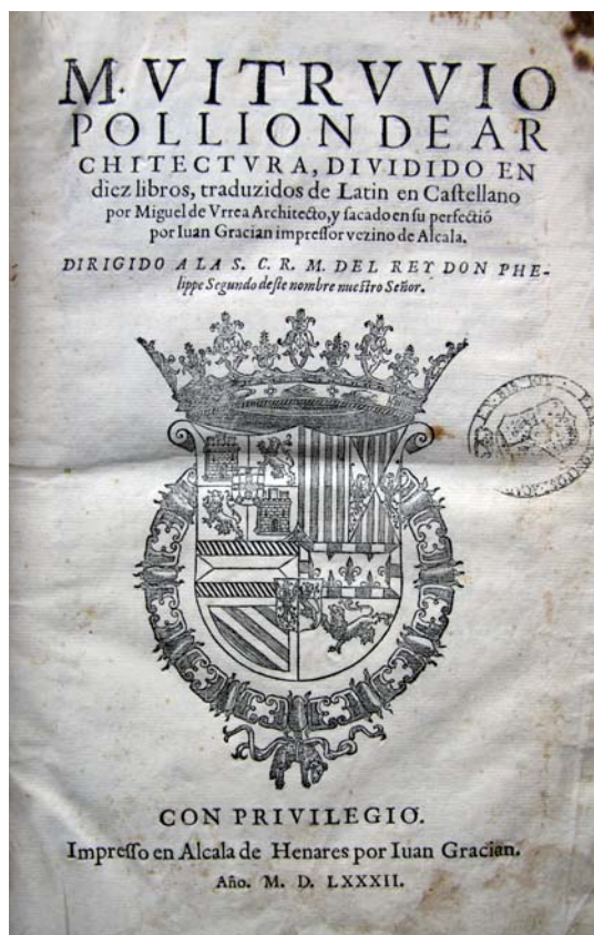
Figura 6. Vitruvio: De Architectura (Alcalá de Henares, 1582).

Vitruvio explica que las medidas del módulo del templo han de tener un origen antropocéntrico (III, I, p. 131-135) 35 , una idea que Vega y Verdugo también comparte al escribir que del hombre «es de quien salen las ymitaciones y medidas para estos artes». La gran diferencia con respecto a Vitruvio consiste en que, para el prebendado, la referencia de la disposición ge-