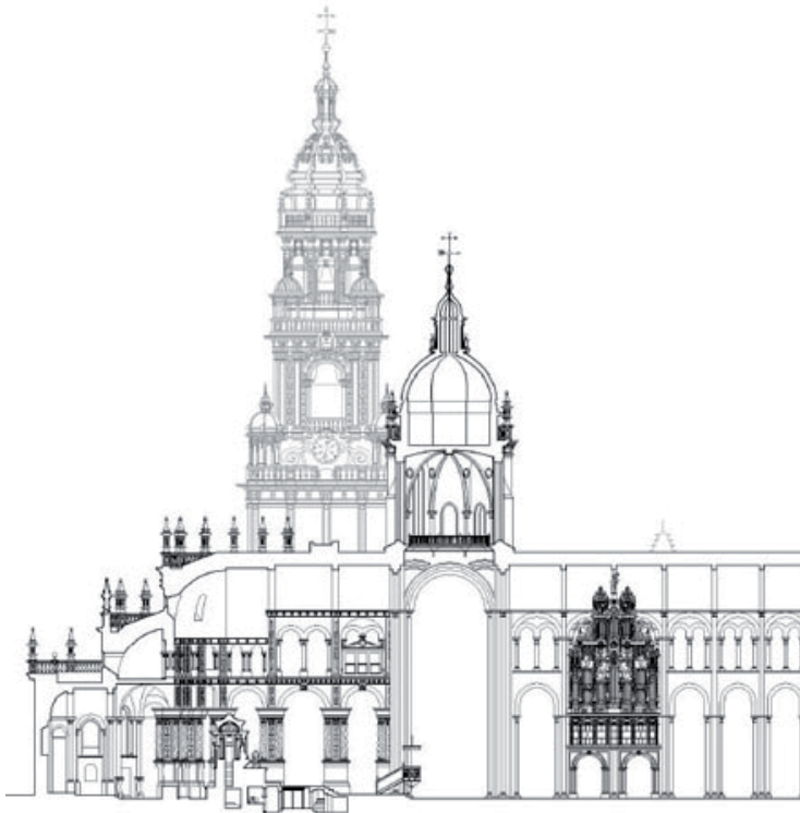
Figura 3. Sección actual de la capilla mayor de la catedral de Santiago. Xunta de Galicia.

muy despectiva, que inicia Rafael, que la califica de misérrima y «sin arte, ni medida, ni gracia alguna» en comparación siempre con la arquitectura antigua 12 . Luego Vasari, en la primera edición de sus Vite (Florencia, 1550), incide en similares adjetivos al señalar que los arquitectos de este periodo desconocían el arte antiguo y «no edificaban nada que en orden o proporción tuviese gracia, diseño o algo racional», una tendencia que, según el italiano, cambia completamente en su tiempo con la instauración del Renacimiento y el estudio de Vitruvio y los edificios de la Antigüedad 13 .