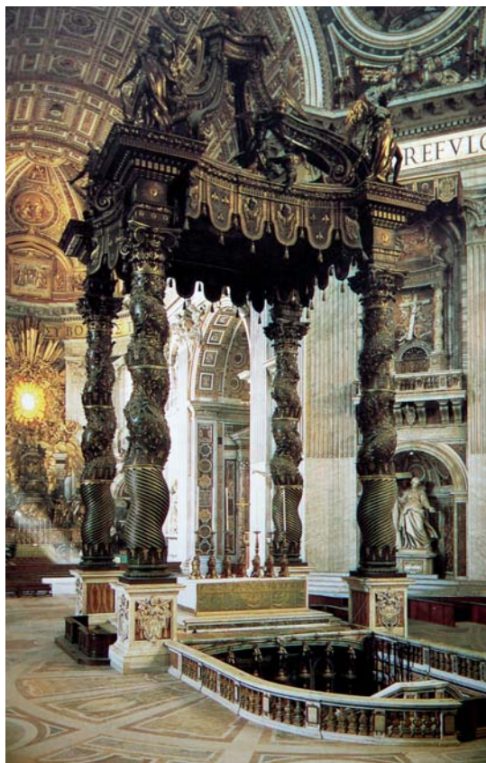
Figura 5. Interior de San Pedro del Vaticano.

regir en la medida de lo posible su desproporción, suprimiendo algunos peldaños del antiguo presbiterio, aunque advierte que se realice con cuidado de no descubrir una supuesta cripta de Santiago, y construyendo un nuevo baldaquino de disposición y dimensiones diferentes a las del entonces existente, obra del siglo XV patrocinada por el arzobispo Fonseca. Su proyecto contempla habilitar únicamente cuatro peldaños, dos en el arranque del presbiterio, entre los pilares de los púlpitos de Juan Bautista Celma, y otros dos a modo de peanas de la mesa del altar mayor. De esta manera, siempre según Vega y Verdugo, primero, el área quedaría liberada de obstáculos y las misas, particularmente las pontificales, se celebrarían más cómodamente, y, segundo, la visibilidad del altar mayor sería mucho mayor desde los sitiales de la sillería de la nave central, particularmente desde la silla del arzobispo. Estas ideas responden a las nuevas necesidades litúrgicas surgidas del Concilio de Trento, a la disposición de la sillería capitular en la nave central, siguiendo el llamado «modo español», y al traslado de la silla arzobispal al centro, presidiendo ambos coros y cegando la puerta de acceso desde la nave 27 . El autor declara emplear como modelo la basílica de San Pedro del Vaticano, cuyo presbiterio carece de peldaños, salvo los obligatorios