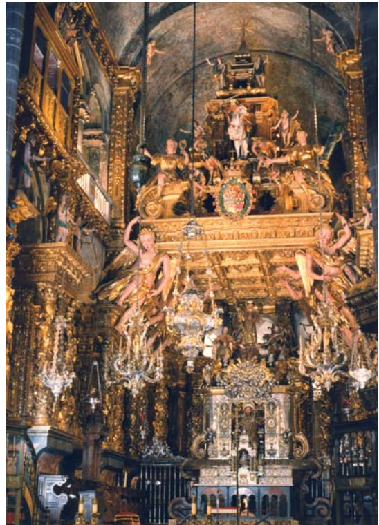
Figura 4. Aspecto actual del interior de la capilla mayor.

[...] lo primero que se pone delante ya se ve que es todo este cuerpo junto, y aquella belleza y buen orden que les enamora la vista, alegra y ensancha el alma, viendo un cuadro