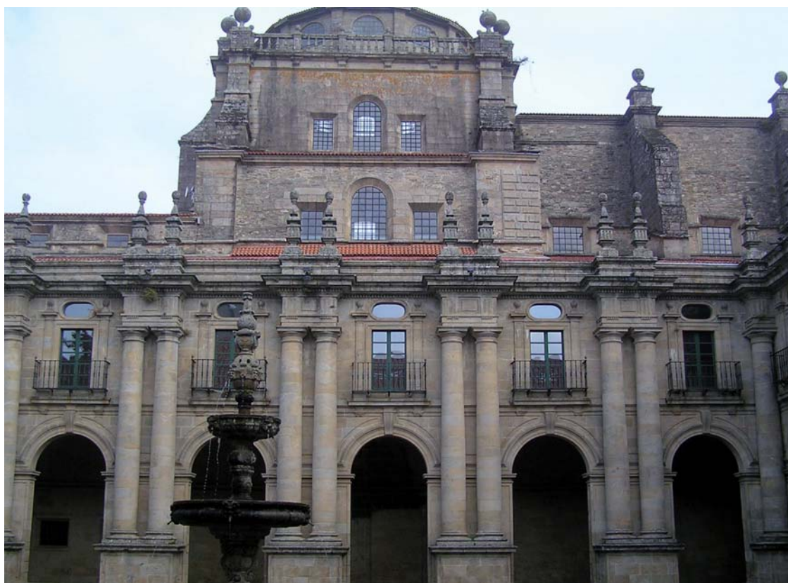
Figura 11. Claustro Procesional e iglesia del monasterio de San Martín Pinario.

comienzo de la construcción del actual claustro procesional, con su monumental orden dórico, a modo de contrarresto, con trazas nuevamente de Fernández Lechuga 53 (figura 11). Dichas confusiones sospecho que aluden tanto al uso de un orden columnario gigante, un hecho poco habitual en la arquitectura española del momento que obligó a no guardar la relación de medidas del orden dórico, como, sobre todo, a la no construcción de una gran cúpula extradósada sobre el crucero de la iglesia, al modo de la que presenta la iglesia de El Escorial, la mayoría de las iglesias romanas y la que él mismo construirá años después en la catedral cuando se convierta en su fabriquero.