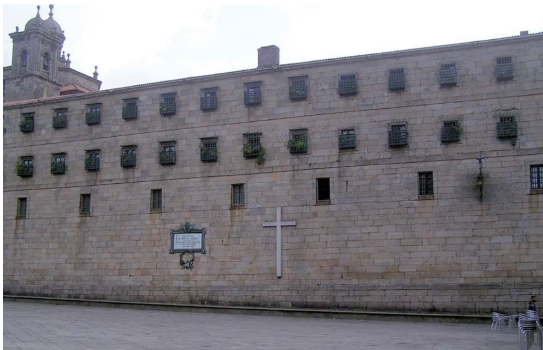
Figura 9. Lienzo occidental hacia la Quintana del monasterio de San Paio de Antealtares.

dió o por los monjes jerónimos del monasterio, para cuya iglesia llegó a aportar trazas el artista italiano 44 .