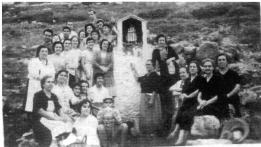
Ermita de Pallerols l'any 1957.