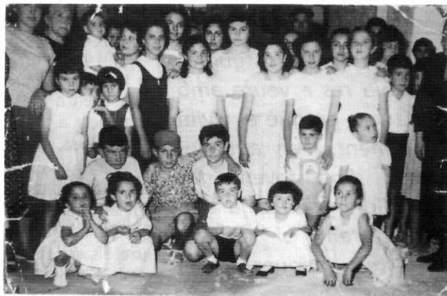
Un dels últims anys que els més joves del carrer Major cantaren els goigs (1956).