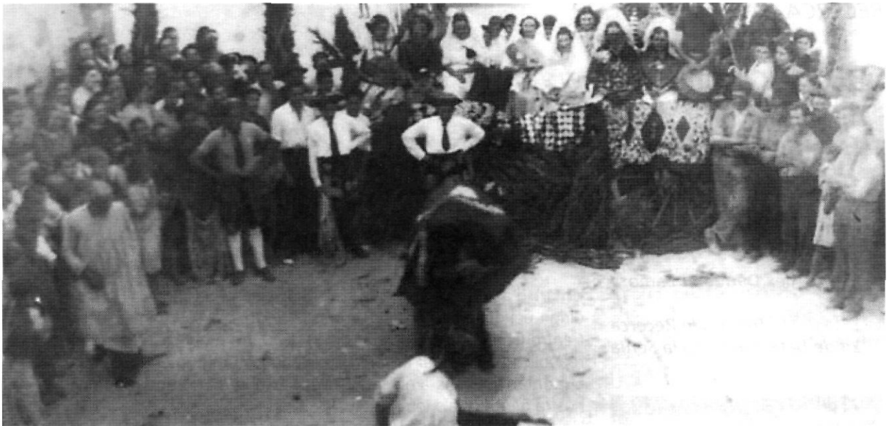
El bou del carrer major, els toreros, les "manoles" i l'expectació (1940)