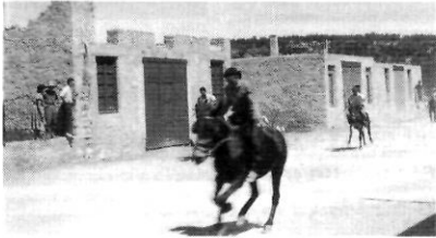
Curses de burros l'any 1948

unes carraques que marcaven les hores: "Un toc, dos tocs...". Hi ha fonts La majoria de testimonis són de l'opinió que en aquells temps es vivia un ambient d'unitat i germanor entre el veïns que era d'envejar. Cooperaven en les festes, s'ajudaven si tenien problemes i treballaven junts en temps de collita. A més a més, les tertúlies a la fresca durant l'estiu, compartir unes bones infusions o entaular un joc de cartes o parxis no faltaven en cap moment. Tot plegat cobria una necessitat social que quedà enterrada amb la televisió. Per això les celebracions com aquesta eren tot un èxit.