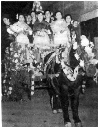
La rondalla de Sant Miquel dalt del carro. Any 1956

com lo Cistellé . Van fer-se uns vestits que recordaven els temps dels seus iaïos per lluir-los a la rondalla. Així, van començar els assaigs i amb l'ajuda dels veïns, que també van abocar el seu suport i entusiasme, i van aconseguir que fos tot un èxit. Fins i tot van escriure un programa d'actes que regia la jornada.