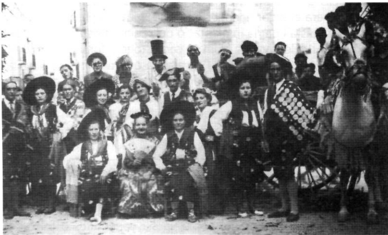
El carrer Major en un dels seus millors moments (1940)

que durant l'any, si no era a festes, poques coses especials hi havia a taula. No obstant això, l'economia de la major part de les famílies del poble no era compatible amb gaires celebracions.