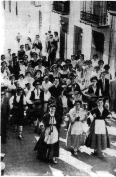
La rondalla de Sant Miquel l'any 1956

La il·lusió dels més menuts del carrer per encendre la foguerada començava unes setmanes abans. Anaven amb una aixada i una corda a estirar argelagues als afores del poble. Després les arrossegaven fins a algun corral i al seu darrere deixaven una bona polseguera, ja que els carrers eren de terra.