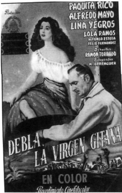
Debla, la virgen gitana. Una pel·lícula de gran èxit.

Amb tot, hi hagué gent que no va anar a veure una pel·lícula al cinema fins que no van obrir el Risol. L'oposició ideològica entre el Centre Obrer i el Club Modern va portar els més radicals d'esquerra a no xafar mai el terreny de l'enemic. El Centre Obrer havia sigut pres per la força de les armes, igual que les llibertats del nostre país. L'orgull i els ressentiments encara eren evidents.