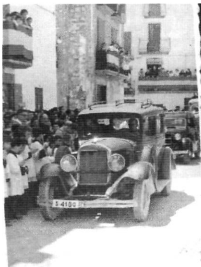
Benedicció dels cotxes

dos tauletes de xocolata com a regal. És aquí on observem la importància del menjar per a la gent que no tenia gaires recursos econòmics.