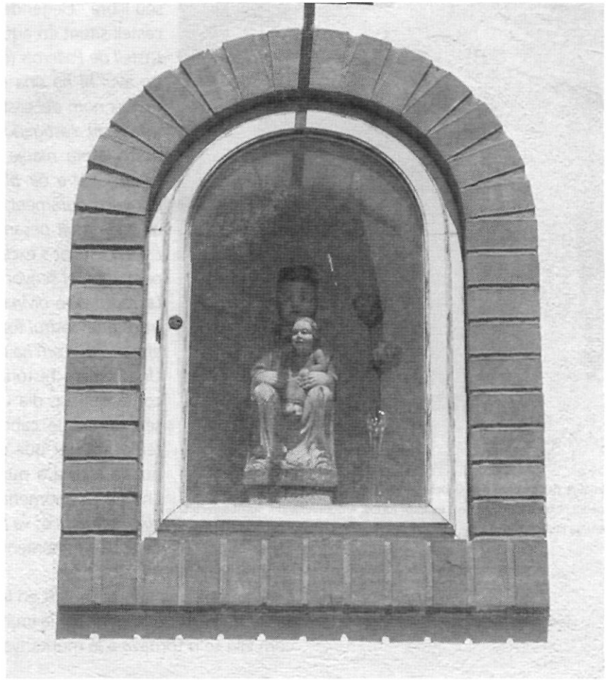
Imatge de la Verge al carrer de Pallerols

La troballa d'una verge cristiana està molt vinculada a tradicions mil·lenàries paganes amb les quals té forts lligams històrics i conceptuals.