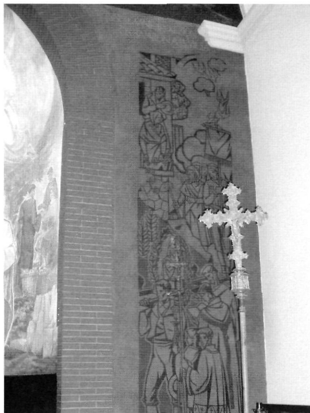
Segons la tradició oral en aquestes pintures van servir de model joves del poble

sofert per les condicions meteorològiques. L'actual imatge que trobem a Pallerols va ser feta de pedra noble de Vinaixa per l'escultor tortosí Antoni Aixendri. Aquest escultor va seguir els trets de les anteriors imatges, encara que simplificant-los i fent-li perdre l'expressió.