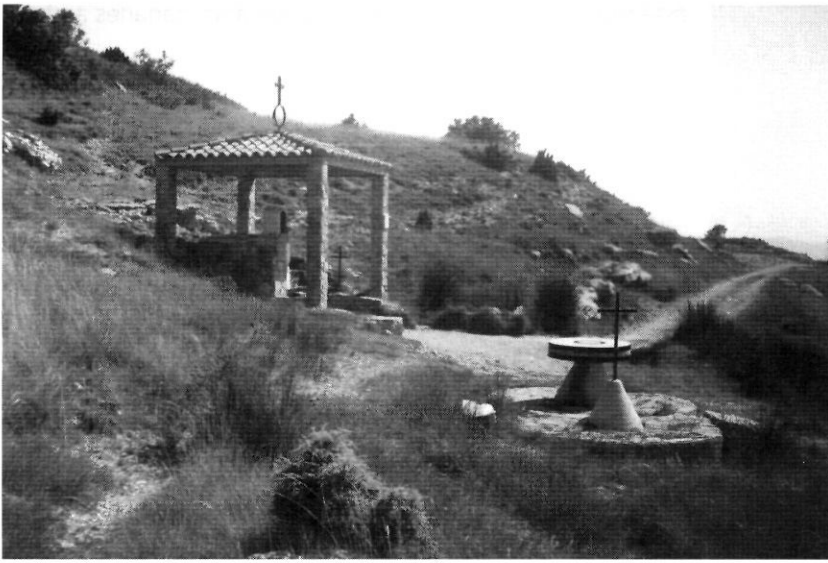
Ermita de la Mare de Déu de Pallerols

circumstàncies històriques i de forma coincidents. El mateix passa amb les del País Valencià veí, on verges tan properes a nosaltres com la de la Font de la Salut de Traiguera, la Mare de Déu de la Font de Castellfort o la de la Balma a Sorita, entre d'altres, corresponen a la mateixa tipologia.