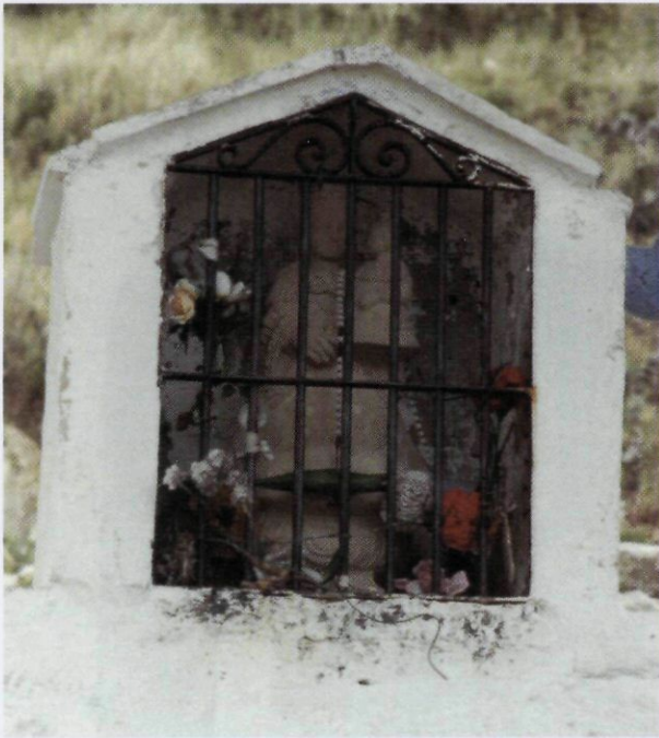
Imatge de la Verge a la Capelleta de l'ermita. Va ser feta l'any 1980 amb pedra noble de Vinaixa per l'escultor tortosí Antoni Aixendri. Substitueix una antiga imatge d'alabastre

seu llibre "Llegendes de Castells catalans" que parla d'un castell situat en aquells paratges: "[...] La Mare de Déu del castell de Pallerols (que s'havia aixecat en terme de la Sénia on avui hi ha una ermita dedicada a la Mare de Déu del mateix nom del castell) donà una lliçó al senyor de la Sénia (Montsià), castigador de renegaires, per als quals el cavaller sentia tanta mania que, expressament, feia desconjuntar camins per a oir blasfemar els traginers i carreters i, així, punir-los durament, fent-los a voltar una grossa sinia, de roda molt pesant. Els tractava, doncs, de bèsties de tir. I si el castigat s'exclamava de la seva dissort amb una altra paraulota, el senyor el feia tirar a un pou d'on ja no sortia. La reprovació divina es manifestà amb una nit de llamps i trons que destruí tot el castell. Damunt de les runes s'aixecà el santuari, com ha quedat dit. [...]".