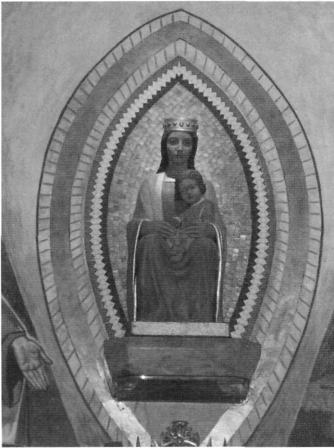
Imatge actual de la Mare de Déu, obra de l'escultor Ferran Bach Esteve, beneïda el setembre de 1963

ens mostra el miracle de la multiplicació dels pans i dels peixos, una eucaristia metafòrica perquè el que Jesús recomana als assistents a les Noces és omplir-se de fe, aliment espiritual, i no d'aliment real. A la volta de l'absis hi ha la representació de quatre àngels que baixen del cel per adorar la Verge, dintre de la més gran tradició mariana. A les parets exteriors de l'absis s'hi van representar diferents passatges que fan al·lusió a la tradicional processó de la Mare de Déu de Pallerols a la Sénia, amb la seua cara il·luminada mentre és venerada pels senienços. Aquestes pintures laterals són siluetes negres sobre un fons verd fosc, estil que dificulta la comprensió de les escenes. Com a encapçalament de les escenes de la part esquerra de la capella hi ha la sentència en català: "Vetlleu sempre Sta. Mare per la Cènia i els seus fills..." i a la part dreta trobem la frase en castellà: "En solemne procesión os bajaron a la villa". Cal dir que sempre s'ha dit entre la gent de la Sénia que alguns joves del poble van servir de models per a les figures representades en aquestes pintures. Davant l'altar trobem un antependi (frontal de l'altar) que representa els quatre evangelistes en la seva forma zoomorfa i que va ser fet amb tesselles i col·locat el 22 d'agost de 1962.