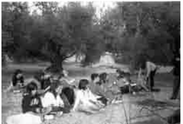
Alumnes aprenent a plegar olives