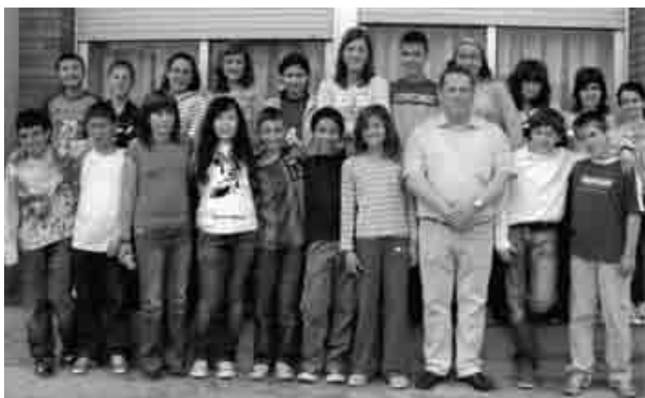
Alumnes de 5è C, curs 2007-2008