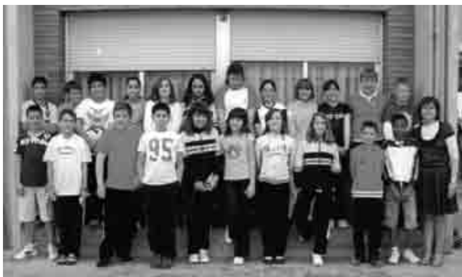
Alumnes de 5è B, curs 2007-2008