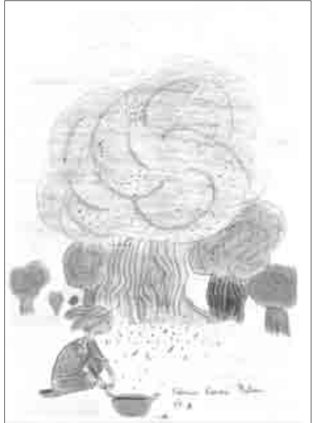
Dibuixos premiats per l'Associació de Jubilats de la Sénia.