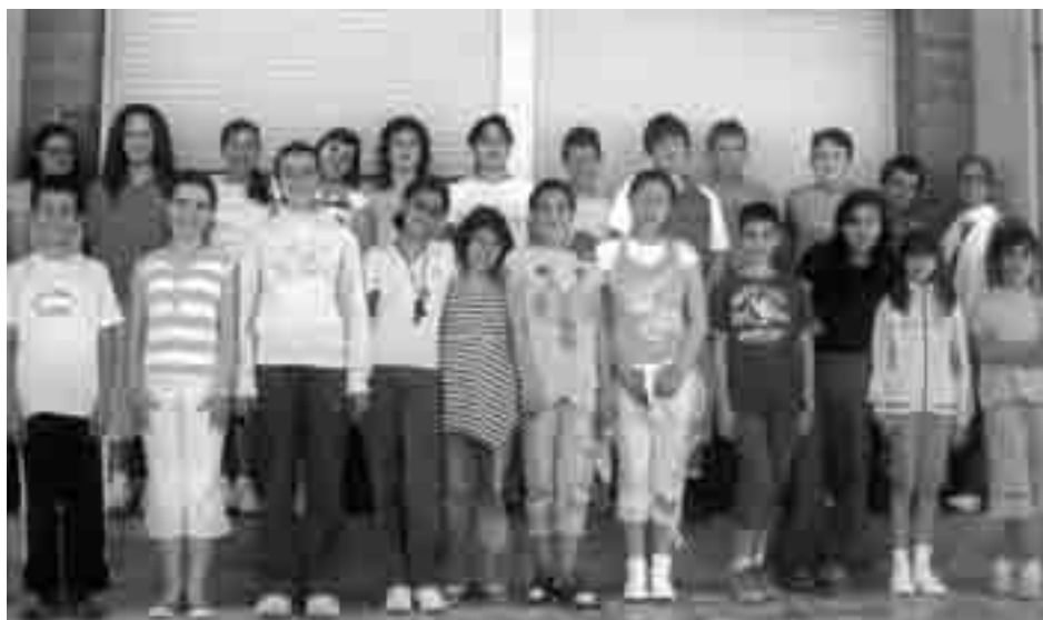
Alumnes de 5è A, curs 2007-2008