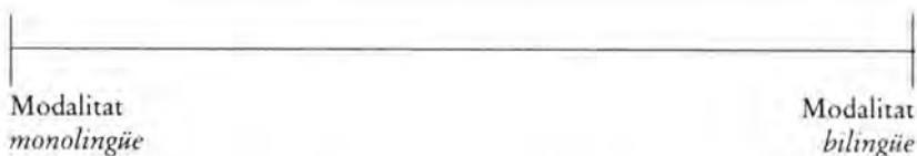
Diagrama 2. El continuum del contacte de llengües

Grosjean accepta que hi ha nivells intermedis, i que hi ha diferències individuals entre parlants –parlants que mai no es mouran de l'extrem esquerre i d'altres que no ho faran de l'extrem dret, en viure en comunitats bilingües molt tancades on la norma lingüística és una parla barrejada. En aquest sentit, es fa difícil d'aplicar aquest model a la situació de contacte de llengües a La Canonja, però les observacions permeten d'establir les pautes següents: